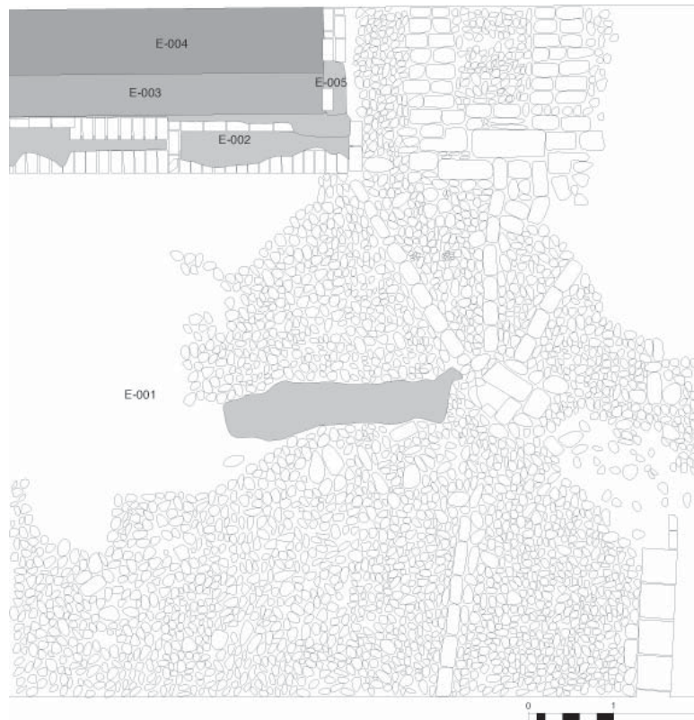
FIG. 1. Planta sector 2. Fase I.