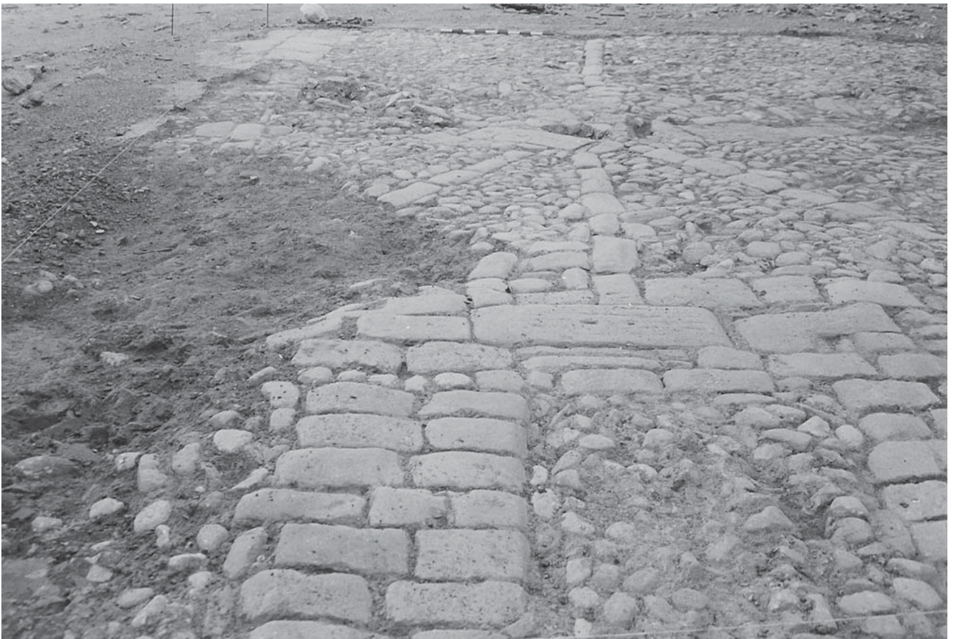
LAM. I. Vista general del sector 2.