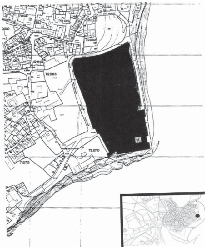
FIG. 1. Plano de localización urbana

El conjunto de la fortificación ocupa un área superior a las dos hectáreas. Está rodeado, hacia el norte y hacia poniente, de una amplia superficie sin edificar de aproximadamente tres hectáreas.