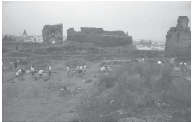
FIG. 6. Interior del recinto. Vista desde el Salón de los Balcones.

Salvo el pavimento exhumado en la CD C, ninguna otra estructura ha proporcionado información para la reconstrucción de la