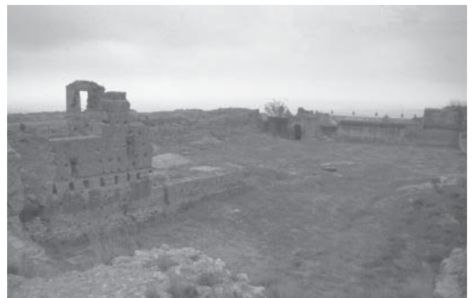
FIG. 5. Interior del recinto. Vista desde la Torre Menor

Descripción: capa de origen artificial, formación artificial, deposición rápida y composición no homogénea, producto de la acumulación reciente de escombros. La unidad no se agotó dadas las circunstancias especiales de la excavación. Presenta gran canti-