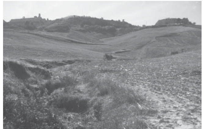
FIG. 2. El Alcázar desde el exterior de la ciudad. Vista desde levante.