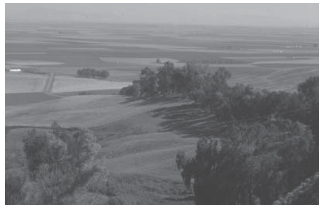
FIG. 3. Vista de la vega del Corbones desde el Alcázar

Se trata de los cortinales o baldíos que se creaban en torno a las defensas por motivos de seguridad y de estrategia militar, que han quedado fosilizados en la trama urbana. Sumadas ambas superficies, la de la fortaleza y la de su entorno de cortinales, ocupan cerca del 10% del Conjunto Histórico amurallado, del que es su edificio de mayor tamaño.