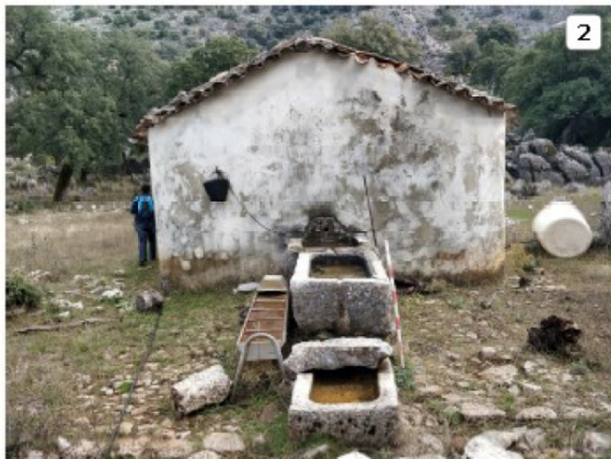
FIGURA 5. Estructuras en la Casa de Cabeza de Caballo (1: Aljibe; 2: Casa de Cabeza de Caballo y pilones asociados).