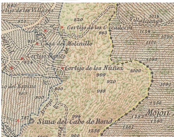
LÁMINA III (PTN. 1918)