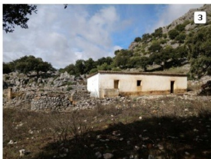
FIGURA 1. Estructuras en la zona