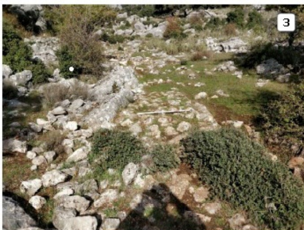
FIGURA 4. Estructuras en la zona Hoyo de la Plancha(1: Pila; 2: Huella de la Pila; 3: Plataforma en piedra).