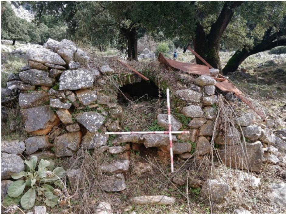
FIGURA 2: Horno de pan.

Además, en el Cortijo de los Núñez se ha localizado un horno de pan de planta circular (Fig. 2) y que aún conserva buena parte de su estructura original, construida en ladrillos (la boca y la bóveda de la cámara de cocción) y piedras calizas irregulares (estructura) a hueso, de mampostería irregular.