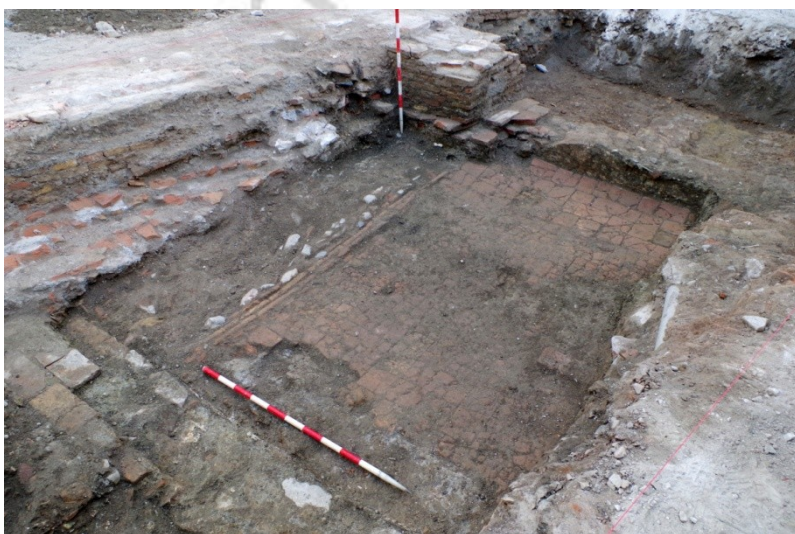
Fig. 2. Pavimento de ladrillo del siglo XIX.

Sobre estos estratos amarillentos se levanta un edificio de carácter residencial orientado de Oeste a Este, del cual se documentan dos crujías. Un primer espacio, situado próximo a la calle, consisten en dos estancias separadas por un muro de mampostería – UE 10-.