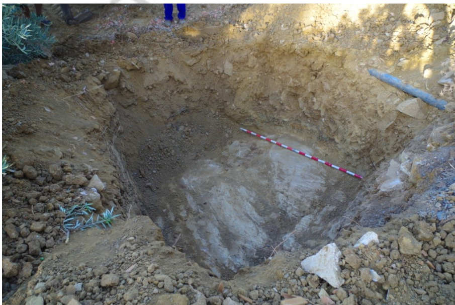
Fig. 3. Detalle del nivel geológico en la base de la cata.

Tras un rebaje de en torno a 1 m aparece el nivel geológico, conformado por una roca calcarenita muy dura y compacta que presente una pendiente pronunciada como los estratos que se le superponen. De este modo se da por terminado el rebaje, estableciendo la existencia de 4 unidades estratigráficas cuyas características se exponen en la tabla siguiente: