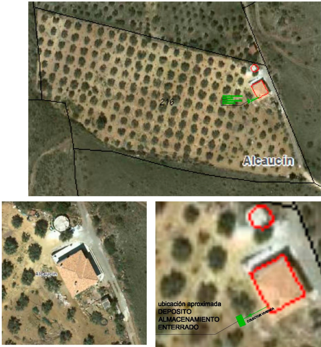
Fig. 1. Ubicación de la parcela y lugar de las obras.

De este modo se procede al rebaje con máquina retroexcavadora con la apertura de una cata cuadrada de 2 m de lado, considerándose tal hueco suficiente para la inserción posterior del depósito de dimensiones de 1,49 x 1,72 m.