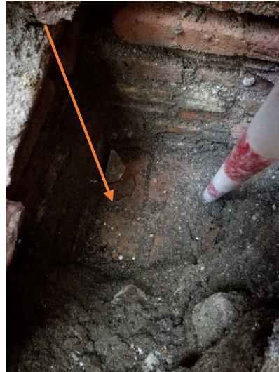
Imagen 2: U.E.22, solería