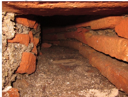
Imagen 4: U.E.14, interior