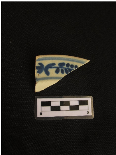
Imagen 3: Borde plato mayólica