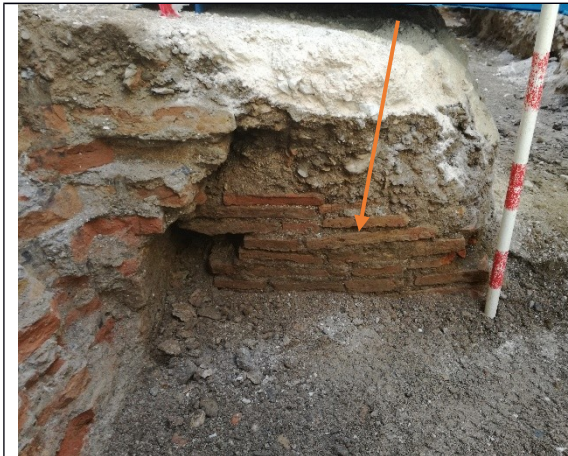
Imagen 3: U.E.15