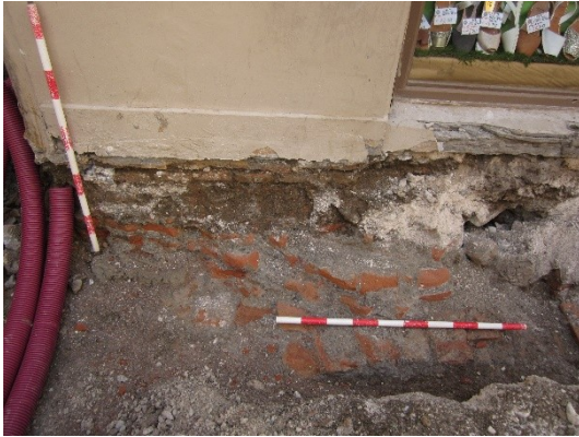
Imagen 1: U.E.15