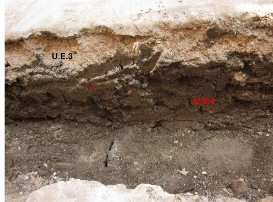
Imagen 2: UU.EE. 2, 3 y 4