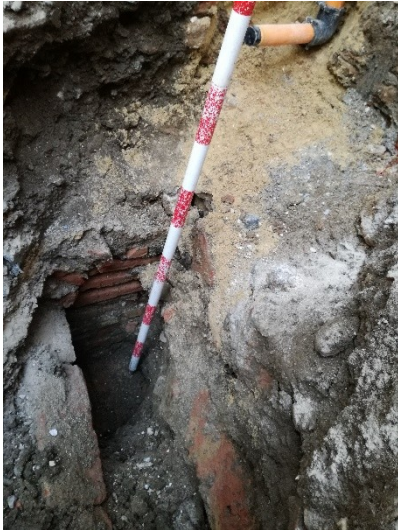
Imagen 1: U.E.22