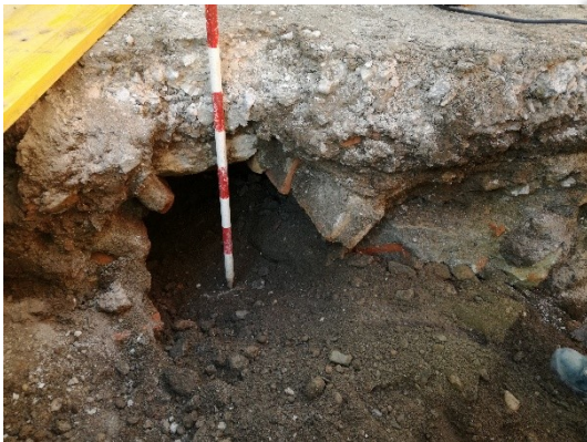
Imagen 3: U.E.24