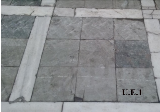
Imagen 1: Solería eliminada