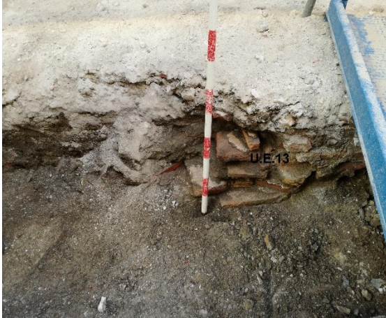
Imagen 1: U.E.13, fragmento 1