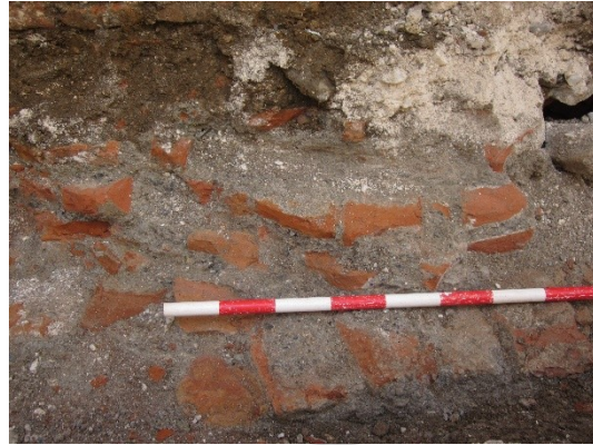
Imagen 1: U.E.15, detalle