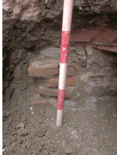
Imagen 2: U.E.9