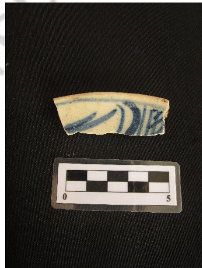
Imagen 4: Borde plato mayólica