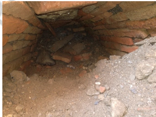
Imagen 4: U.E.24, interior