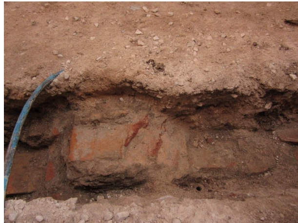
Imagen 2: U.E.2, detalle