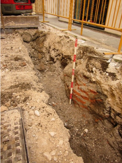
Imagen 1: U.E.8