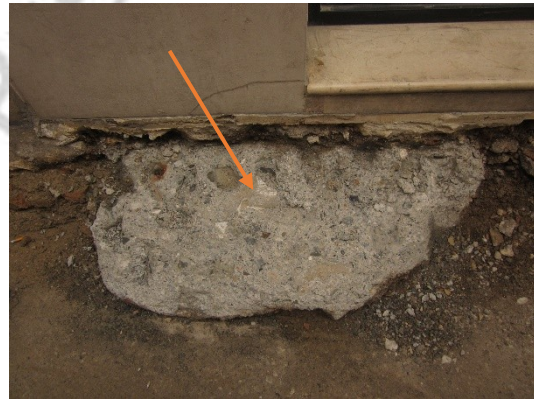
Imagen 4: U.E. 11