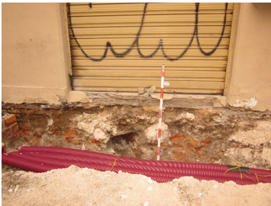
Imagen 3: U.E.14