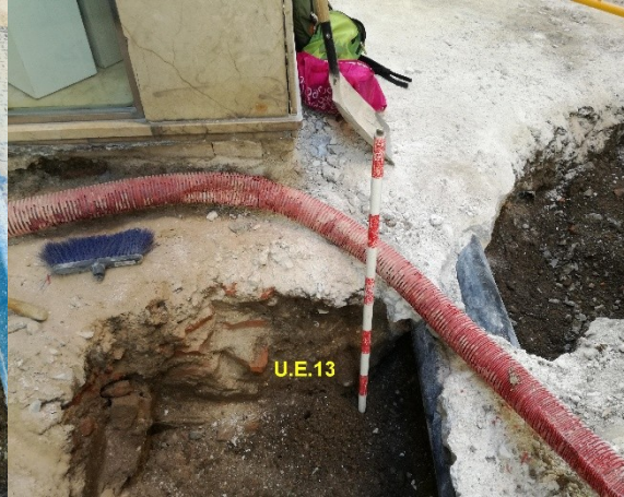
Imagen 2: U.E.13, fragmento 2