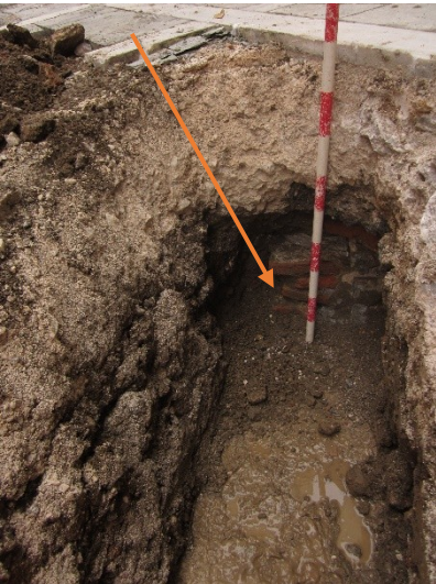
Imagen 3: U.E.9. Detalle