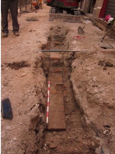
Imagen 1: U.E.12