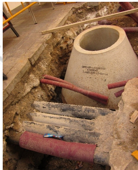
Imagen 4: U.E.10