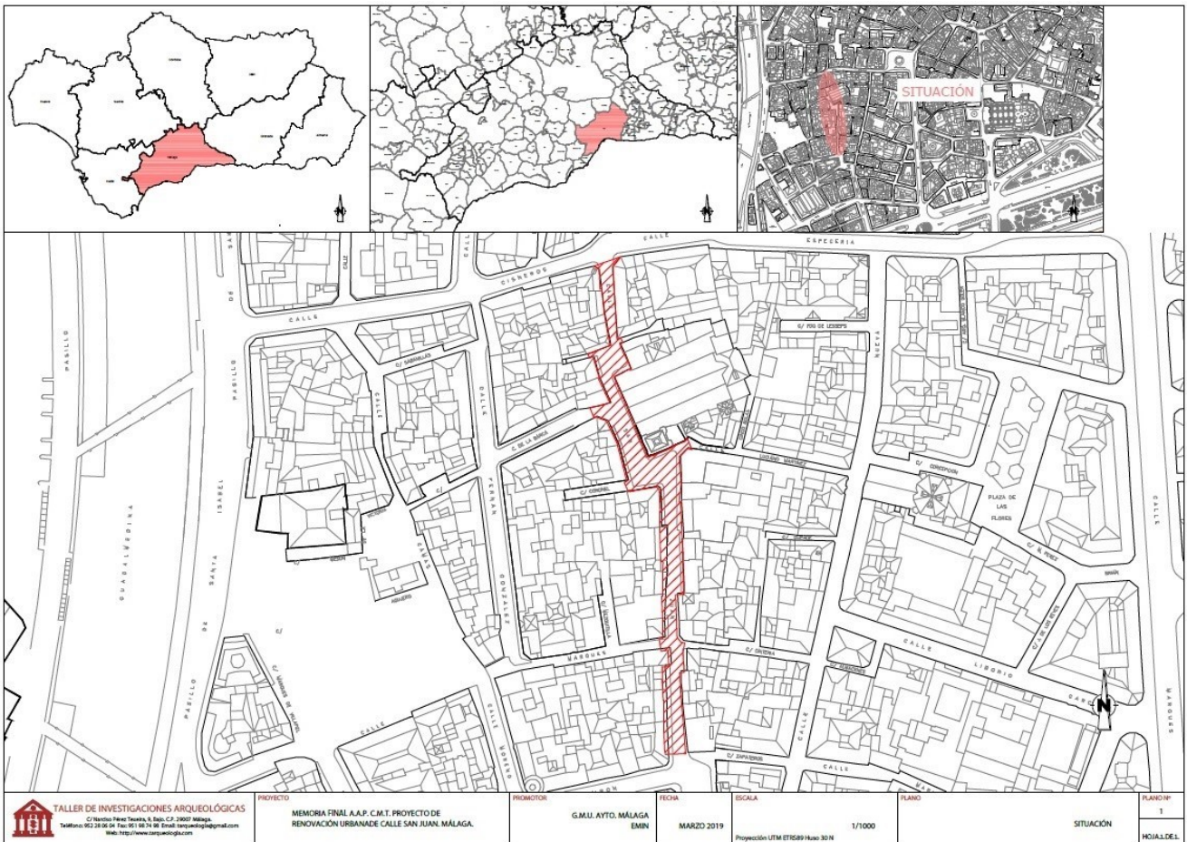
Figura 1: Situación