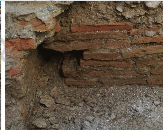
Imagen 4: U.E.16, atarjea