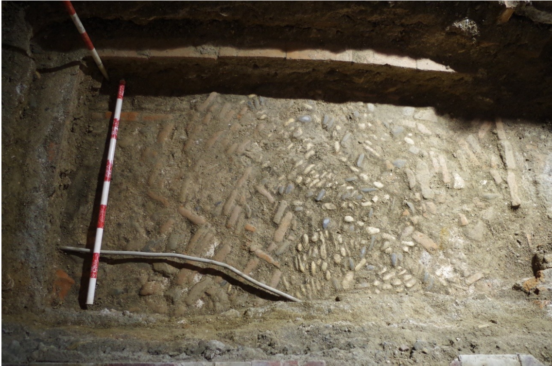
Fig. 3. Pavimento empedrado UE 3.1 de la fase 3 del Corte 3. Siglos XVIII-XX.