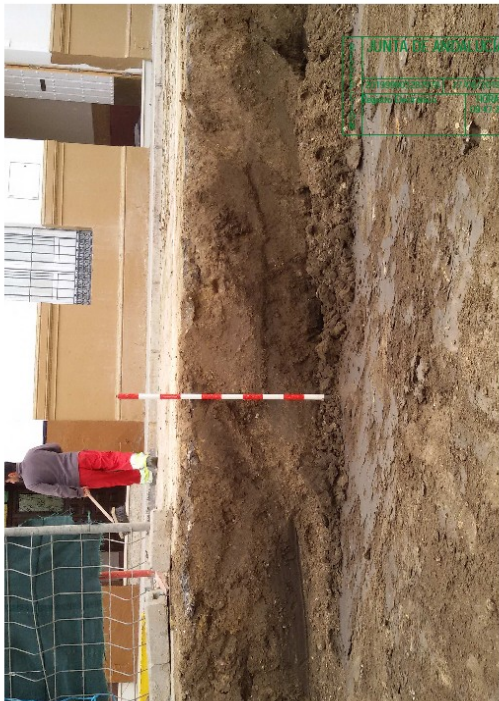
Figura 4: Vista del solar una vez realizada la excavación