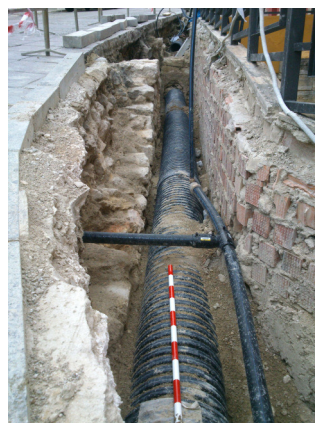
Lámina 09.- Detalle del muro U.E. 18 planta.