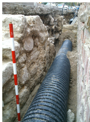
Lámina 08.- Muro U.E. 18 desde el sur.