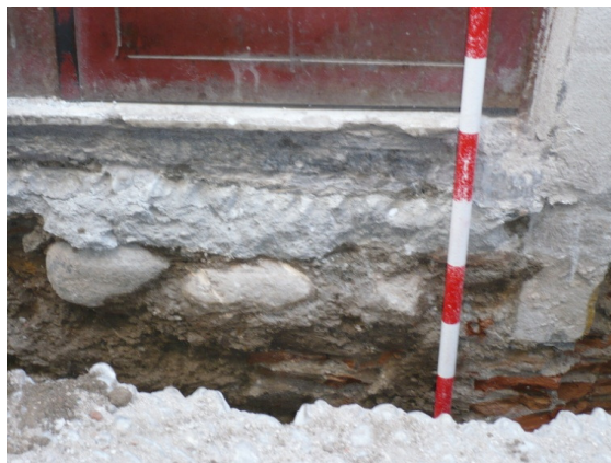
Figura 4. Detalle de pavimento empedrado.