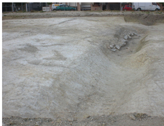
Lám III: Vista norte Parcela SA-1.