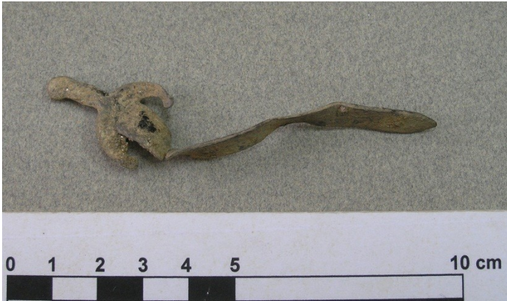
Espada de plomo. Se trata del segundo ejemplar localizado en Algeciras.