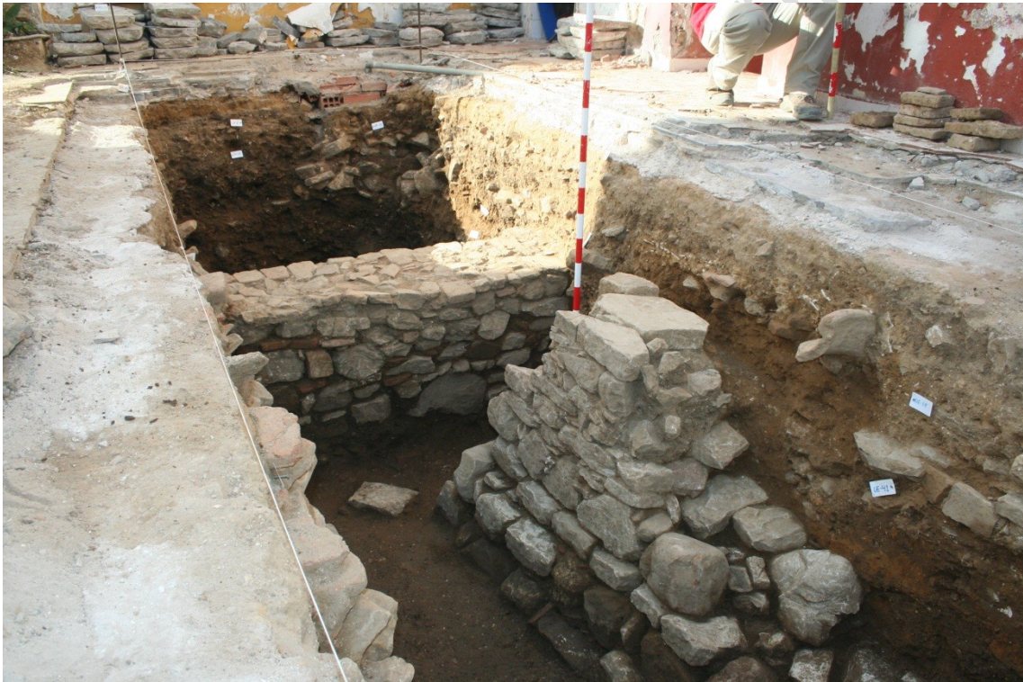
Vista hacia el sur. En primer plano la UEC 17 y en un segundo plano la UEC 27.