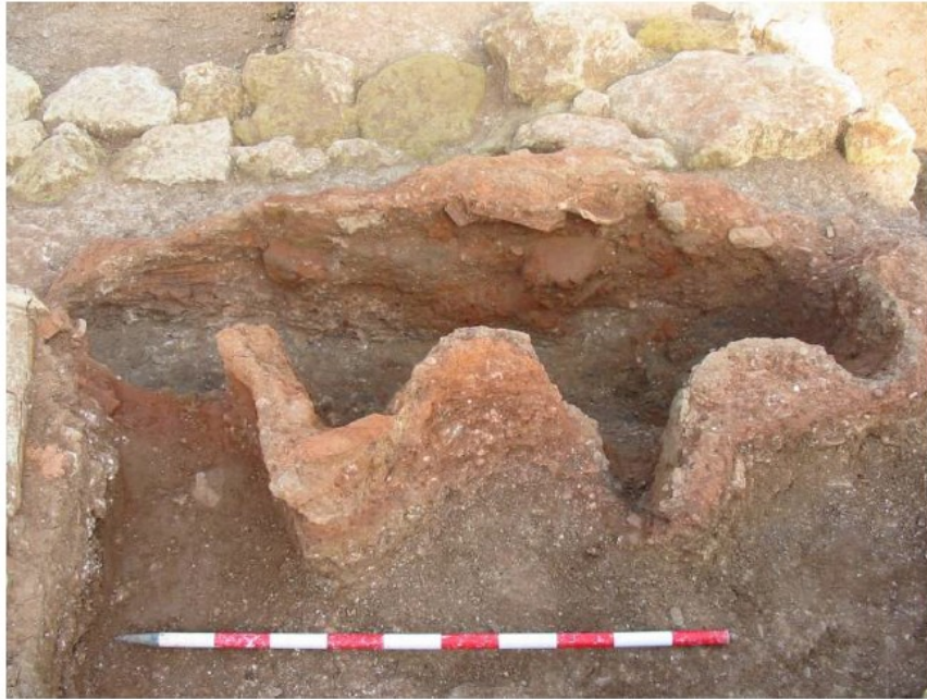
Lámina 06.- Parcial del horno nº 2.

- Planta. Presenta forma elíptica con una longitud de 2.20 de largo por 0.56 de ancho y 0.60 de altura conservada. Posiblemente estemos ante los restos de la cámara de combustión, ya que presenta las características propias de este tipo de estructuras. Presenta sus lados menores (N-S) circulares mientras que el lado oriental es prácticamente recto. Cuestión aparte merece el lado oeste que se nos muestra con tres sinuosidades con entrantes y salientes que podrían responder a la colocación de las toberas del horno en la misma pared del mismo. La cama de esta estructura es cóncava y presentó cenizas en su interior.