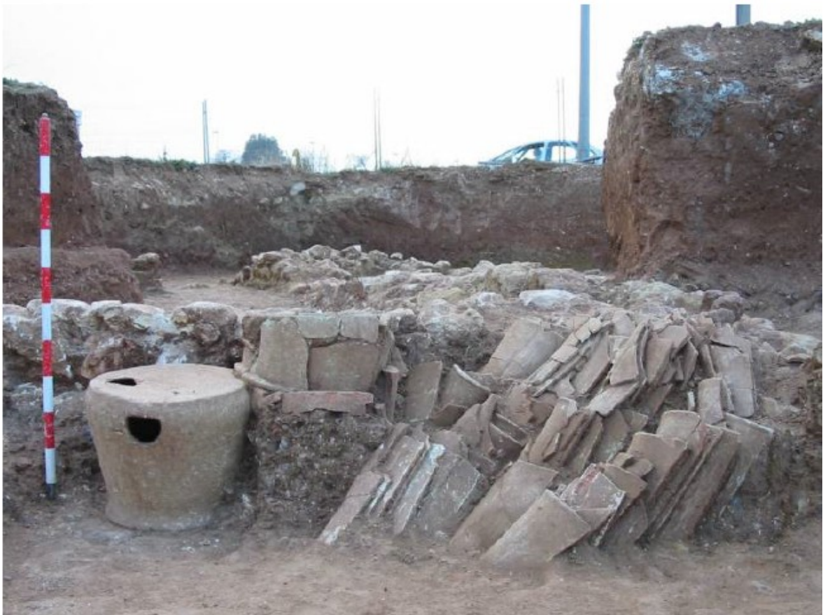
Lámina 03.- Detalle del acopio de material cerámico documentado en el espacio B.

Fue excavado en la esquina suroccidental de la manzana 19. El área documentada estaba abierta por su lado oriental, en su lado Norte por la u.e. 28 y en su lado occidental por la u.e. 41. Tiene unas dimensiones 2.20 m. de longitud por 2.10m. de anchura. La funcionalidad del espacio dadas las dimensiones documentada y el material recogido y el tipo de muros medianeros nos hace presuponer la existencia de un estancia cerrada destinada a almacenamiento de la producción cerámica de alguno de los hornos adyacentes como demuestran las uuee. 44 y 59. (LÁM. 03)