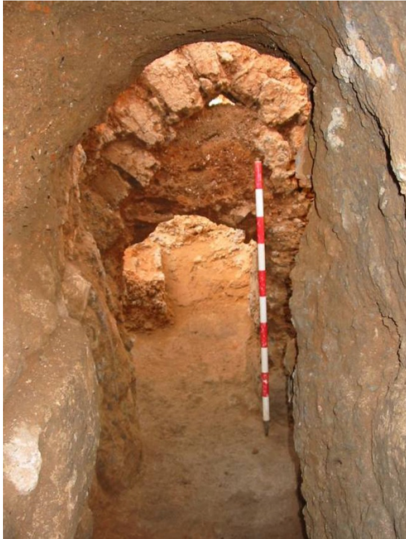
Lámina 07.- Detalle del acceso a la cámara de combustión del horno nº 5