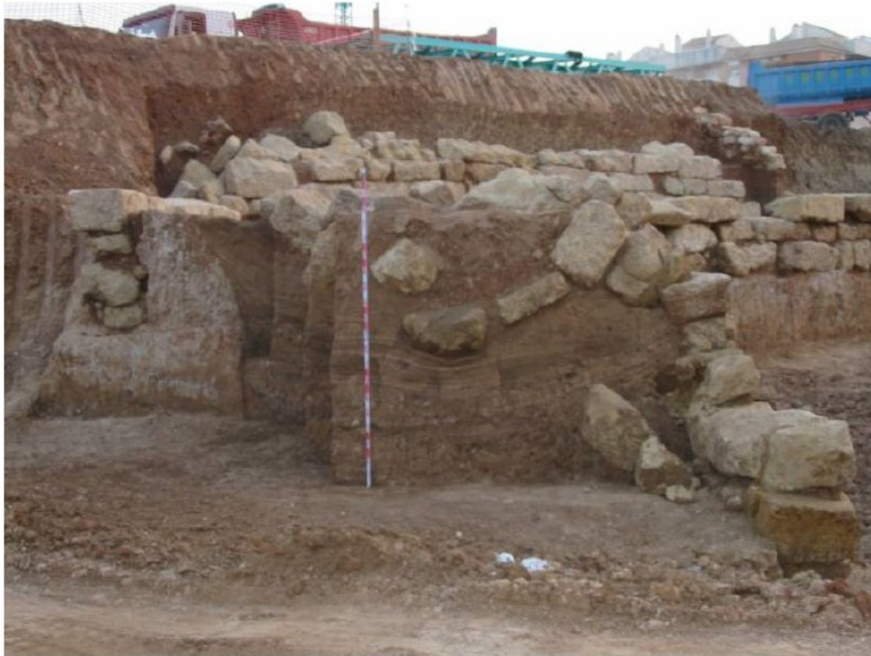
Lámina 09.- Sección estratigráfica del vado documentado en la intervención.

Se han trabajado un total de dos meses durante los cuales se ha puesto al descubierto estructuras negativas y positivas correspondientes, en todos los casos a época medieval islámica: desde finales del s. X a inicios del XI d. C. Los restos documentados apuntarían a un uso macroespacial del espacio de carácter industrial con la presencia de 6 hornos de cerámica y una urbanización espacial en torno a una calle que actúa como eje principal ue 170. Se documentaron una serie de espacios que actuarían como comercios con fachada a la calle, a la par que tendrían una función doméstica en época califal, y que estarían estrechamente coenctados con uno de los arrabales situados al noroeste (LÁM. 09) de la ciudad amurallada, que surgieron en Córdoba como consecuencia de la gran expansión califal.