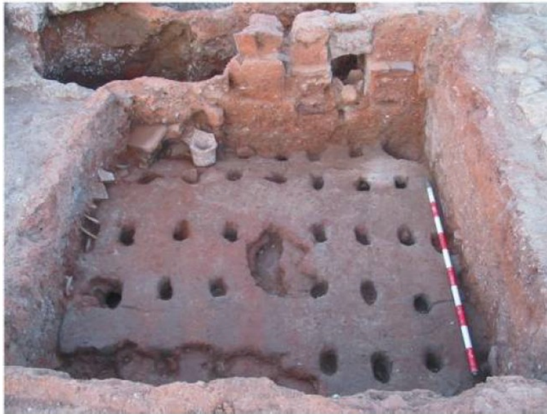
Lámina 05.- Proceso de excavación del horno nº 1.

- Parrilla. Se encuentra bien conservada estando surcada por una veintena de orificios circulares. Presenta unas dimensiones de 1.40 x 1.40 aprox.