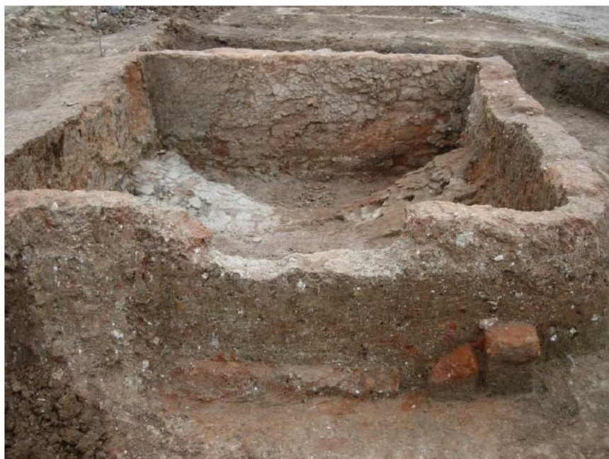
Lámina 08.- Cámara de cocción del horno nº 6 durante la intervención.