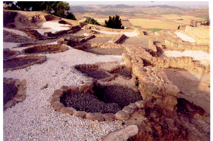
Lámina II. Detalle de las estructuras siliformes localizadas en 1997