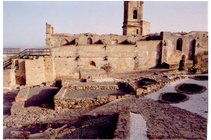
Lámina I. Vista de la Villa Vieja y su trama urbana del siglo XVI