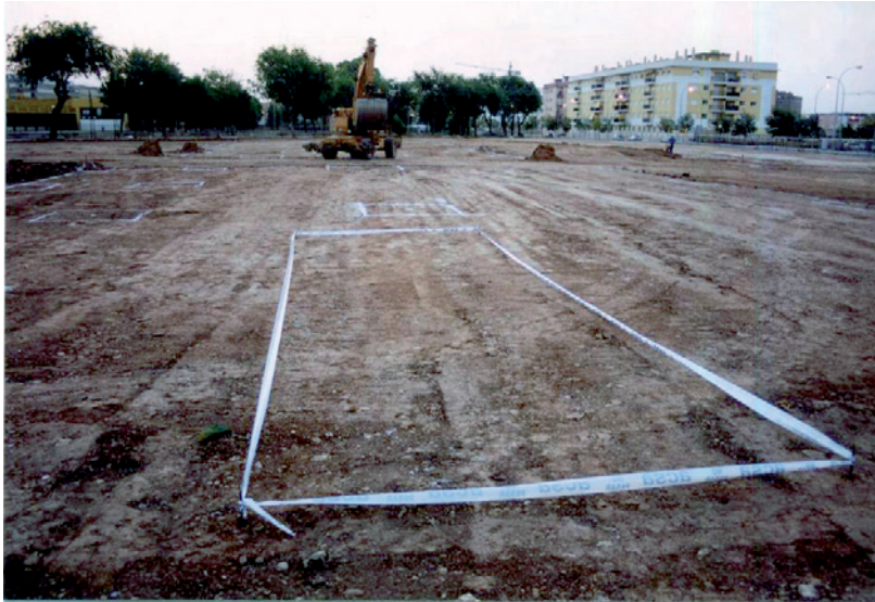
Lámina I. Inicios de los trabajos mecánicos.