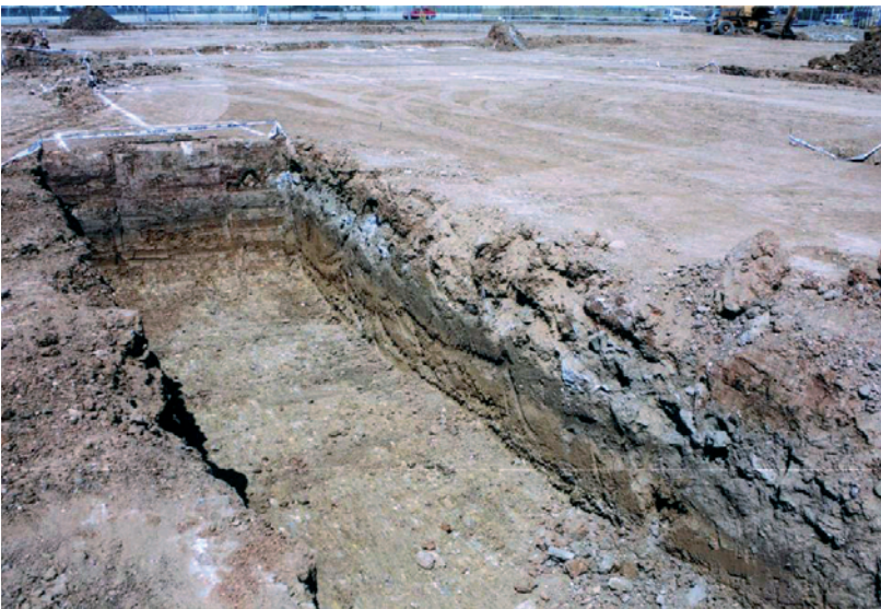
Lámina III. Vista general del sondeo 1.