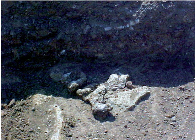
Lámina II. Sondeo 14 tras la finalización de la excavación manual y la documentación de la cimentación de mampostería.