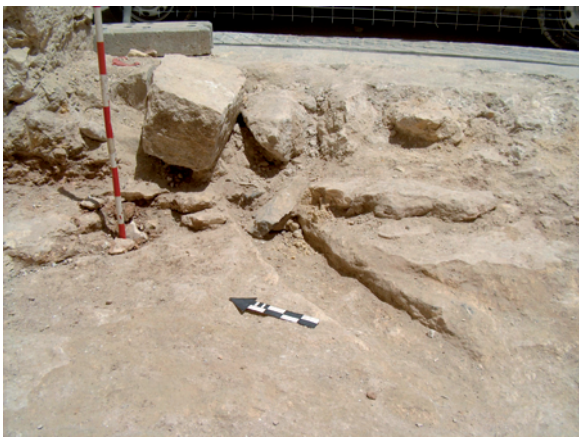
Lámina I. Detalle de elementos estructurales pertenecientes a la última vivienda existente en el solar, denominada Vivienda 1

Fase 2. Corresponde a un momento de ocupación inmediatamente anterior al descrito para la vivienda 1. Tanto la disposición de las unidades estratigráficas como la descripción de las mismas, hacen pensar en la existencia de un inmueble anterior sobre el que se levantó el derribado. Pertenecen a esta fase las unidades estratigráficas 4, 5, 6, 7 y 8, unidades deposicionales y estructurales que conforman otra unidad constructiva diferente a la descrita para la vivienda 1. La unidad 4, corresponde a la cimentación de un inmueble diferente en el que puede apreciarse en alzado como dicha unidad sustentó un paramento (U.E. 7) que actuó de medianera con el inmueble ubicado al SW. del solar, dicha medianera, en el solar nº 17 ha desaparecido, pero en el alzado de la vivienda colindante correspondiente al nº 15 de la misma calle, es todavía apreciable, embutiéndose en dicha parcela, lo que indica la trama de otra vivienda diferente que ocupó al menos parte del solar nº 17 y parte del nº 15 de la misma calle y que fue parcialmente dividida para albergar dos inmuebles diferentes. Consideramos entonces que estamos ante otro momento de ocupación diferente y al que hemos denominado vivienda 2. A este espacio de ocupación se le asocia el suelo de guijarros, descrito como la unidad 5 y el nivel deposicional inmediatamente inferior descrito como unidad 6, sobre el que se sustentó el primero. Consideramos a tenor de la descripción de