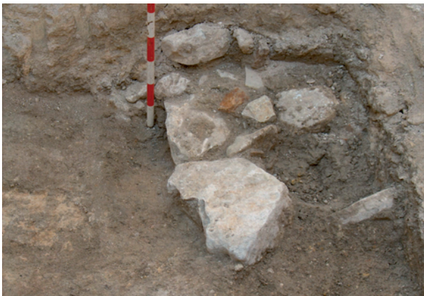
Lámina VIII. Detalle de U.E. 11