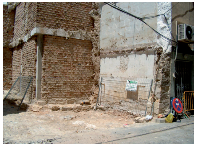
Lámina II. Detalle de elementos estructurales pertenecientes a la vivienda 2, que han perdurado en la vivienda 1

Fase 3. Se corresponde con la U.E.3, descrita como cimentación de un inmueble anterior a la construcción de la vivienda 1, se ubica bajo los restos de pavimento perteneciente a la U.E.1, rompiéndola con posterioridad la U.E.10. Se trata de un momento de ocupación