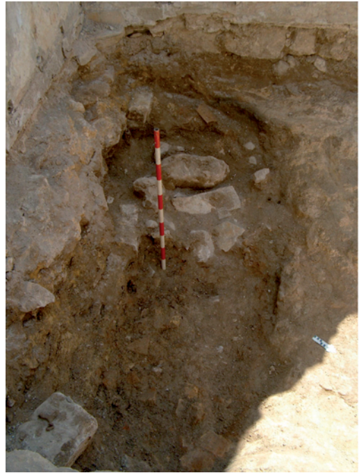
Lámina X. Planta de horno cerámico