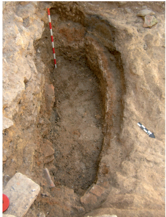
Lámina XI. Horno cerámico excavado. Cámara de refracción