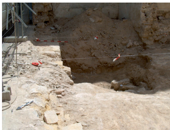
Lámina V. Espacio excavado en el nivel geológico de uso industrial

horno cerámico junto con el aporte de atifles nos hacen pensar en un momento bajomedieval o mudéjar, fechándose dicho conjunto estructural entre los siglos XIII-XIV.