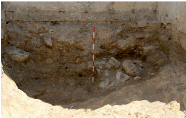
Lámina IX. Nivel de colmatación y derrumbe del horno cerámico