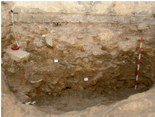
Lámina XIV. Detalle de perfil W.