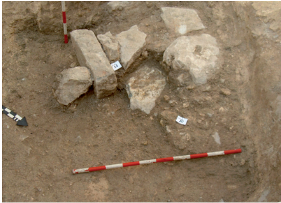
Lámina VII. Detalle de estructura a nivel de cimentación localizada dentro del espacio de uso industrial