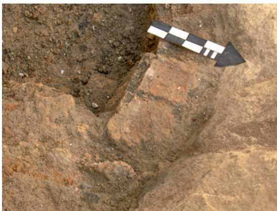
Lámina XIII. Detalle de restos de la parrilla de horno cerámico