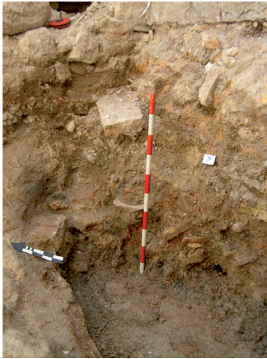
Lámina XII. Detalle de perfil W. y U.E. 5