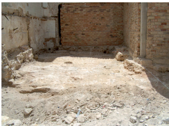
Lámina III. Restos de cimentación pertenecientes a la vivienda nº 3

diferente a la vivienda 1 y 2, posiblemente anterior o coetáneo a esta última, que corresponde a otro inmueble que hemos denominado, vivienda 3.