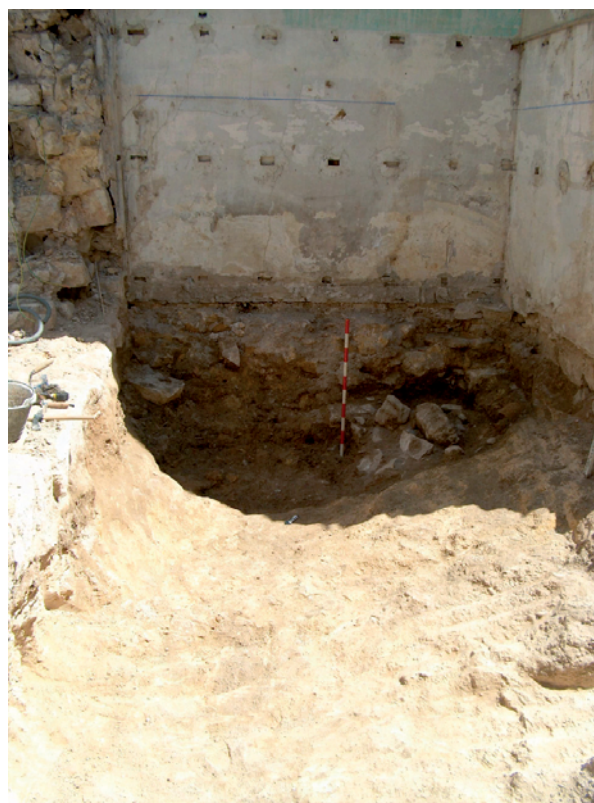
Lámina VI. Espacio excavado en el nivel geológico de uso industrial