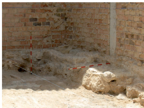
Lámina IV. Detalle de U.E. 3

Fase 4. Corresponde a un momento de ocupación anterior a la construcción de la vivienda 3, que tanto por la descripción de los niveles estructurales como deposicionales describen un uso y ocupación del espacio del solar totalmente diferente al descrito hasta el momento. Las unidad 12, conforma un espacio rectangular de aproximadamente 1,00 m. de profundidad, excavado en la roca, en el que se dispone un complejo estructural compuesto de un muro de piedra de módulo medio y disposición irregular, del que se ha conservado la primera hilada del mismo (U.E.14) y un horno cerámico (U.E. 18), conservado parcialmente. Ambas estructuras están asociadas, constituyendo un espacio de uso y funcionalidad industrial. La descripción del material cerámico aportado por el nivel de derrumbe (U.E. 17), fechan este espacio en un momento posiblemente Islámico o Mudéjar. La descripción de los tipos cerámicos aportados, fundamentalmente piezas de almacenaje de sólidos y líquidos, de tipo común y uso doméstico, representado en fragmentos de lebrillos, alcadafes y orzas, mayoritariamente con decoración vidriada melada. Todas estas piezas aparecen de un modo escaso, no siendo así el número de atifles localizados dentro de éste mismo paquete deposicional. La descripción de estos tipos cerámicos no permiten una fechación fiable, ésta sin embargo se realiza en base a las evidencias estructurales asociadas, la descripción del