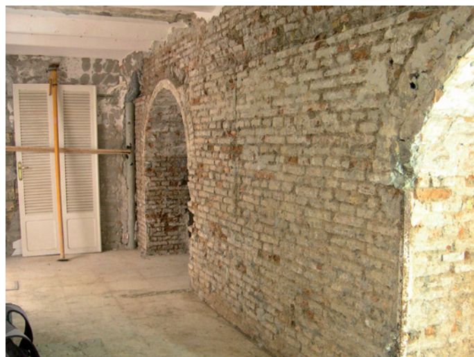
Lámina III. Estancia de acceso actual al sótano. Se observan reformas en la cubierta.

En el extremo oeste del paño U.E. 50 se abre un respiradero abocinado U.E. 53, de 1,08 de ancho, actualmente soterrado bajo el acerado de la calle Torneo. Todavía conserva una reja de hierro semioculta entre los cascotes del relleno de nivelación del mismo.