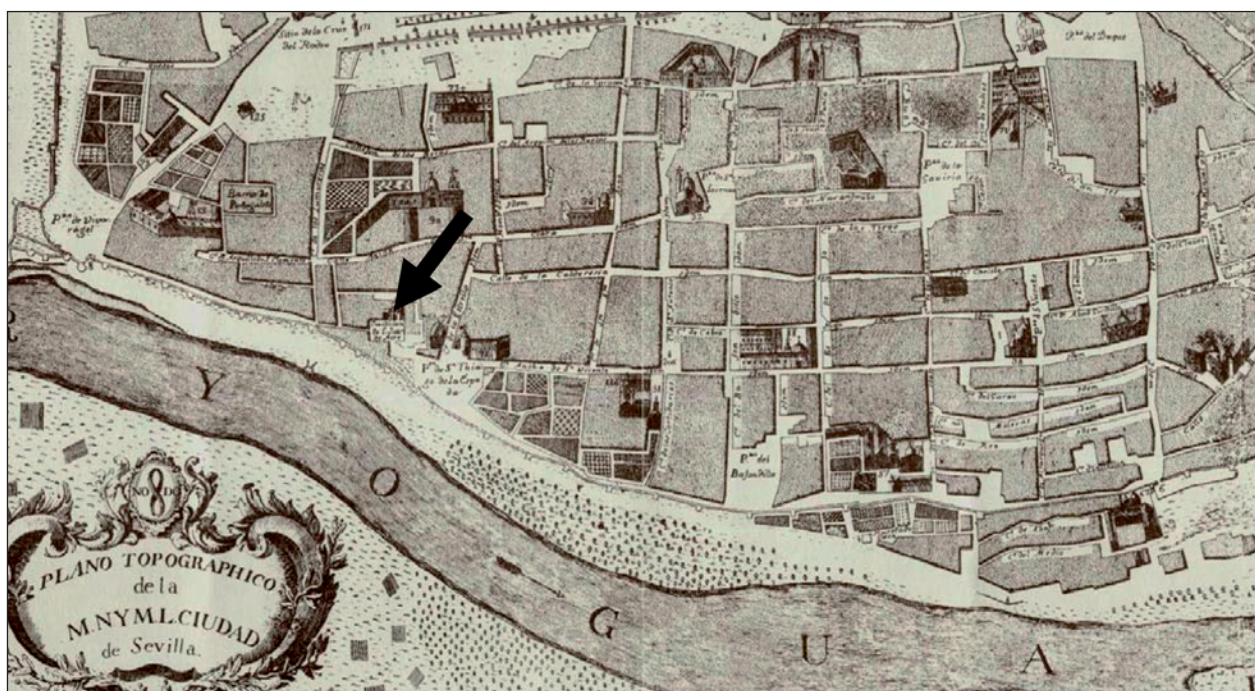
Lámina I. Plano topográfico de Sevilla del Asistente D. Pablo de Olavide. Año de 1771. Localización de la parcela Torneo 27-28 con la muralla aun en pie.

De este modo, se procedió al picado de los paramentos de la estructura central del sótano, así como del resto de los muros y cubiertas del mismo para retirar los azulejos contemporáneos. Al quedar al descubierto la fábrica original de ladrillo, se acuerda la realización de una cata de auscultación en el muro norte de dicha estructura, con el fin de establecer si la cara externa es un “forro” o envoltura de saneamiento de un cuerpo interior de tapial o responde a un proceso constructivo diferente y completamente ajeno al sistema defensivo islámico.