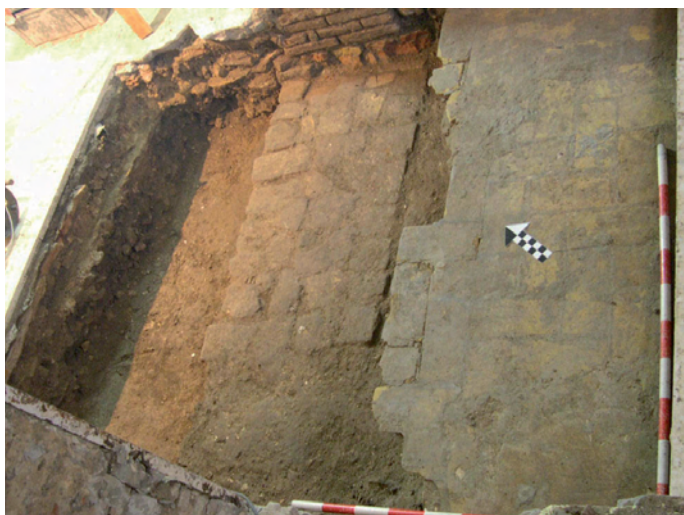
Lámina IV. Imagen general del sondeo en el que se observa la solería a la palma original y el zuncho U.E. 38.

Esta estructura, con eje noreste-suroeste, presenta unas dimensiones originales de 2,20 x 0,70 m y se encuentra a la cota +7,04 m. Su cimentación U.E. 24 consiste en un conglomerado de fragmentos cerámicos y cascotes constructivos, tierra y cal, con una cota superior de 6,89 m y una potencia máxima de 30 cm. En ella hemos localizado un azulejo de fines del XIX-principios del XX, fechando así el momento de construcción del sótano.