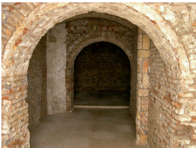
Lámina II. Corredor sur. El muro situado a la derecha de la imagen corresponde a la estructura central.

El nivel de pavimento original lo hemos podido establecer a través del sondeo realizado en el extremo noreste del sótano, donde se ha localizado una solería a la palma U.E. 4, a -8 cm del nivel de suelo actual (U.E. 1) (6) cuyas características y estado de conservación describiremos de manera más amplia en el apartado siguiente.