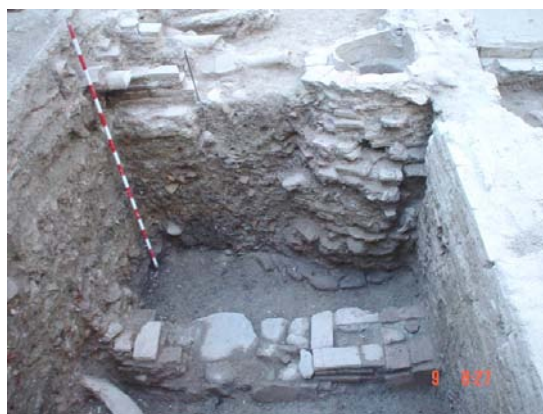
Lámina I. Muro de ladrillos

De esta fase se localiza también una tinaja de barro, de grandes proporciones, de 1m. de diámetro, conservándose parte de la boca, (posteriormente en las labores de rebaje se rompió ), que serviría de contenedor y estaría dispuesta sobre el suelo de la estancia, CE- 04. Se encuentra colmatada por la UEN-0002, anteriormente descrita. (Lámina II)