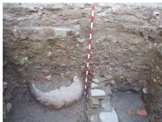
Lámina II. Detalle de la tinaja