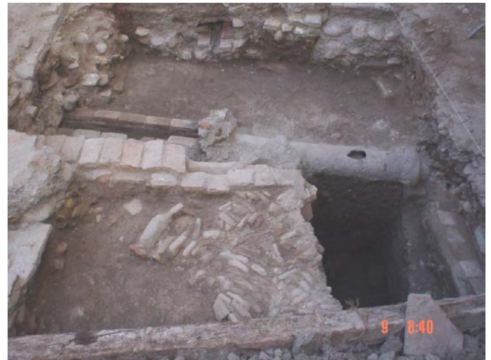
Lámina VIII. Detalle del suelo del sector 1

A este periodo se adscribe un suelo de ladrillos dispuestos a sardinel, (E- 008 ), que se presenta cortado por la red de saneamiento de la zona (E- 005 ). Asociado a este suelo, se localizan dos atarjeas de ladrillos de barro, una de ellas localizada en el perfil oeste, E-009, que apoya directamente sobre el muro de tapial.(Lámina 8)