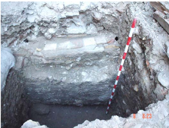
Lámina VII. Detalle del muro de tapial del sector 1 (23-00-21)

Esta fase crono cultural está representada por la estructura E-013, un muro de tapial que aparece aislado. La técnica constructiva empleada es de cajones de tapial con aglomerado de mortero de cal grasa con unas dimensiones de 0,80 x 0,30 m .x 0,80 m. Por la zona del sector (Perfil Oeste) y el tramo localizado tan corto, no se podían advertir las dimensiones del cajón. Tiene una dirección Norte-Sur y tras los trabajos de seguimiento se pudo documentar un mayor tramo en dirección Norte que se introducía debajo de la vivienda colindante, así como el ancho del mismo, 0'45 m., sin embargo aparte de documentar más recorrido no conseguimos obtener información que lo contextualizara. De esta forma se configura un espacio sin estar definido, cuya funcionalidad es imposible aclarar debido a la recortada visión ofrecida. (Lámina 7)