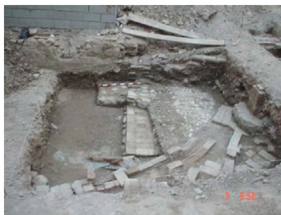
Lámina IV. Vista general sector 2

En el sector 1-C, se localiza una pileta CE-06, colmatada por un nivel de tierra de relleno, UEN-0001. Esta unidad, está conformada por tres tabiques, y se presenta adosada a un muro E- 009, como hemos mencionado en el párrafo anterior. La funcionalidad sería la de contenedor de agua. Presenta unas dimensiones al interior de 1,30 m. x 0,60 m. Se conserva parte del suelo de ladrillos, que le sirve de preparación al suelo de terrazo, y donde van ubicados dos sumideros de entrada y salida del agua, en el muro oeste y en el suelo respectivamente, se presenta enlucida de mármol y el suelo de terrazo. La fábrica del alzado de estos muretes es de ladrillos de barro trabados con mortero de cal y arena. Encontramos en algún tramo de los tabiques, algunos fragmentos de mármol que conformarían el borde de la alberca y su revestimiento ya apuntado anteriormente. Sobre el muro E-009, al que se adosa la pileta, se localiza una estancia de la que se conserva parte de su pavimento de ripios de pequeño tamaño, enmarcados por dos hiladas de ladrillos de barro dispuestos a sardinel, en forma de cuadrículas, al nivel de este suelo se localiza la boca del pozo (E-010), conformado por una tinaja que presenta una abertura de 0,60 m. de diámetro, y que a 0,40 m. de profundidad, se ensancha. Esta estructura se encuentra por su parte externa revestida de ladrillos de barro, trabados con mortero de cal y arena.