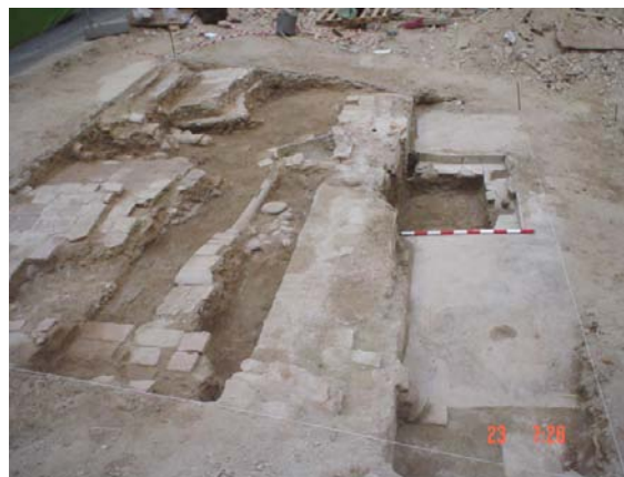
Lámina III. Vista general sector 1

Esta fase está representado por un muro de ladrillos del que se conserva 2, 20 m. de su alzado, construido de ladrillos de barro E- 012, trabados con mortero de cal y arena, (no se ha localizado el alzado completo del muro, al no rebajarse más que lo proyectado en las labores de cimentación del edificio a construir), que presenta en su cara sur zarpa de cimentación de ladrillos, para salvar el desnivel existente y se asienta sobre los muros de la fase moderna (E-055, Sector 1 B y E-061, Sector 1C ), a los que corta perpendicularmente. y presenta unas dimensiones de 2,60 m x 0,65 m. x 2,20 m. presenta forma longitudinal y en sentido Norte Sur y conecta con la E-009, muro de ladrillos trabados con mortero de cal y arena, al que se adosa por su lado sur la pileta, localizada en el patio. Estos muros se encuentran colmatados por la UEN-0001, una tierra de matriz arenosa de coloración marrón y tonalidad clara, con la presencia de abundante material de construcción (tejas, ladrillos muy fragmentados) pertenecientes a la vivienda demolida y algún fragmento de cerámica moderna y contemporánea.