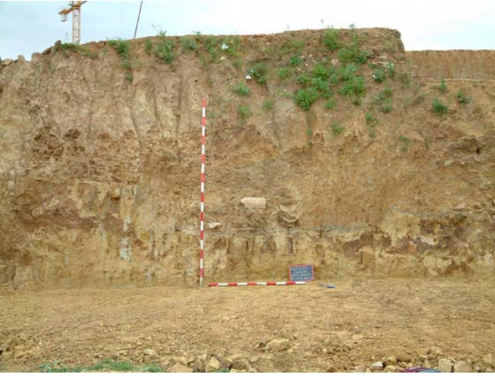
Lámina V. Vista del perfil norte del sector 3