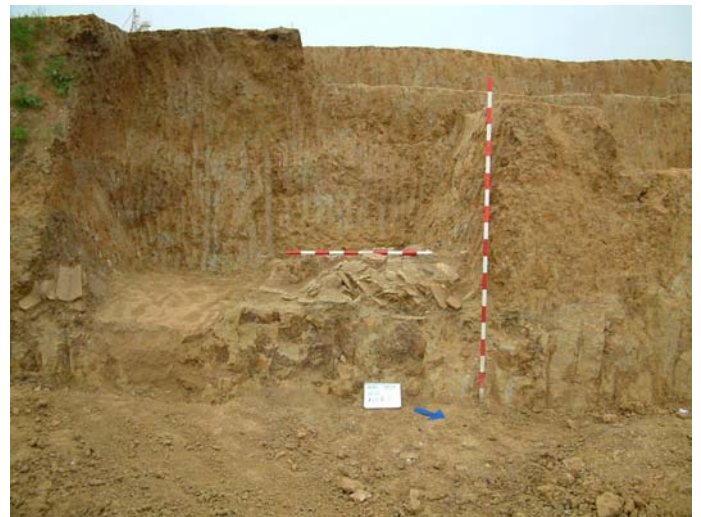
Lámina IV. Acumulación cerámica del Área 3