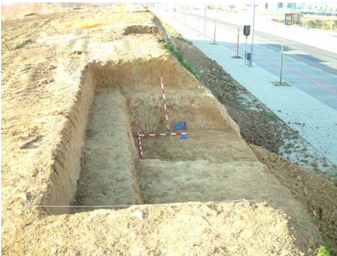
Lámina III. Vista Gral del Área 3