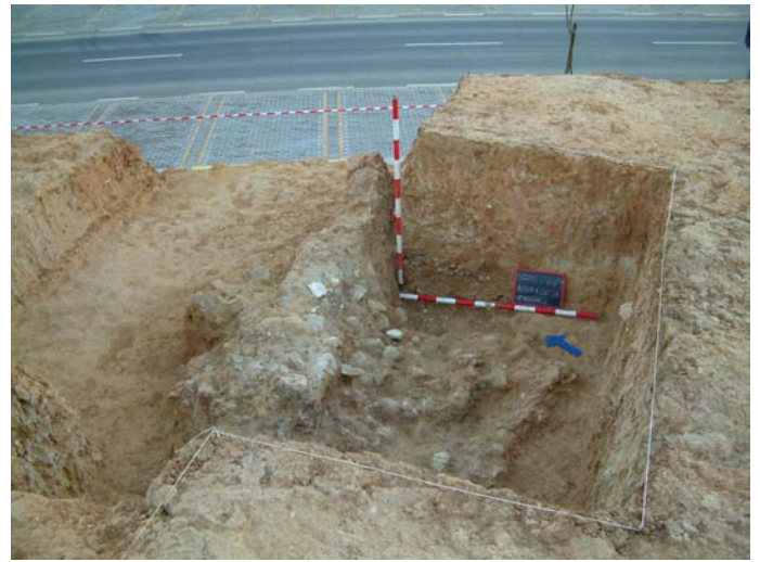
Lámina II. Detalle del Área 1