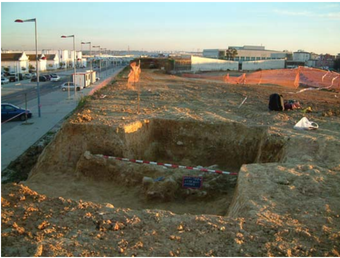
Lámina I. Vista Gral de los cortes estratigráficos