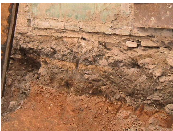
Lámina V. Perfil Este. Niveles de relleno y base geológica.