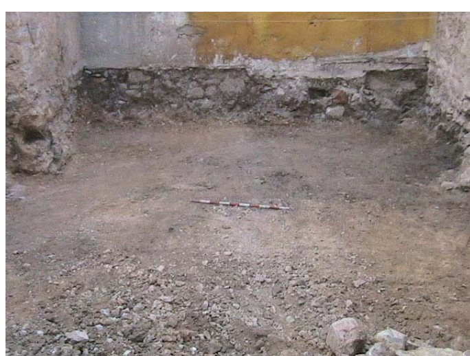
Lámina VI. Planta final.