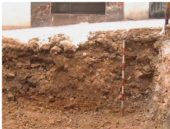
Lámina II. Perfil Sur. Niveles de relleno.