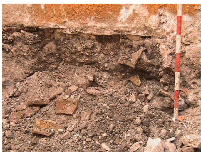
Lámina IV. Sector Norte. Detalle fragmentos cerámicos.