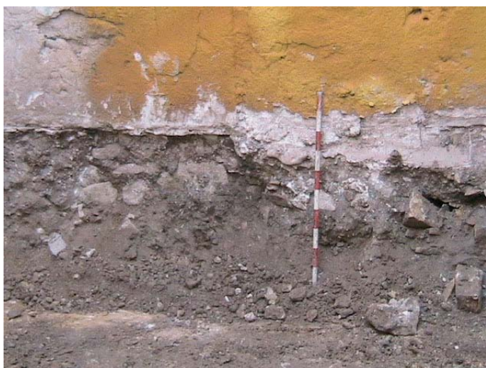
Lámina III. Perfil Norte. Niveles de relleno