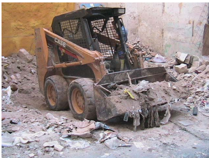
Lámina I. Trabajos de limpieza del solar.