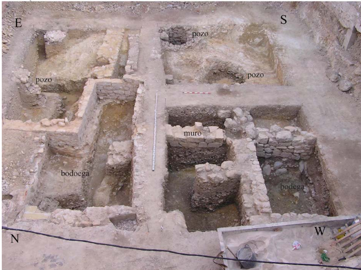
Foto 1. Final de excavación

El único nivel de origen antrópico que hemos documentado en la excavación en esta fase, se localiza en la zona este del corte 2, destruido posteriormente por la creación de una bodega en su zona oeste. Este se trata de un nivel de huerta, compuesta de tierra arcillosa rica en detritus con algo de piedras y cerámica adscribible a esta fase. Suponemos que este nivel continuó manteniendo su funcionalidad en siglos posteriores hasta la configuración urbanística de la zona.