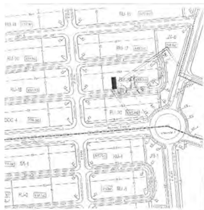
Figura 1. Situación geográfica del solar

El solar se encuentra ubicado en el lado Sur de la parcela RU 19-6-O del SUNP1 de Marroquíes Bajos de Jaén.