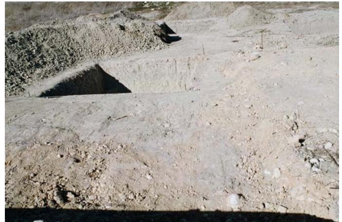
Lámina III. Imagen final de la intervención vista desde el lado Sur de la parcela.

En cuanto a los fragmentos cerámicos encontrados, muy pequeños y rodados, nos muestran las diferentes fases de ocupación de la zona hasta la época actual.