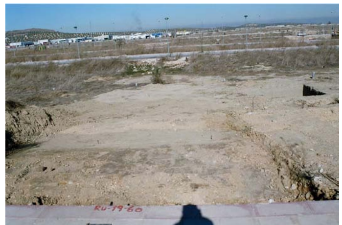
Lámina I. Planteamiento de la intervención, en la zona central del solar situado a la derecha podemos ver el sondeo por lo que aquí se planteó al fondo de la parcela, zona que no estaba documentada.

Una vez limpio el solar de la cobertera vegetal se procedió a plantear dos sondeos en un eje de orientación Sur-Norte de 3X4m el primero y de 3X5m el segundo, que se realizó al fondo del solar, ya que la zona central estaba documentada por dos sondeos realizados en la parcela colindante a éste por su lado Este.