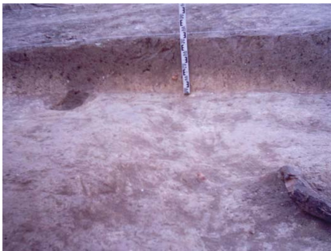
Lámina II. Transect 1. Aquí podemos ver junto al perfil una huella de vid y en la esquina inferior derecha lo que queda de una raíz de olivo. Es la muestra de dos tipos de cultivo que se han practicado en esta zona.

No se han hallado restos de estructuras que nos indiquen que hubiera algún tipo de asentamiento o hábitat en esta zona, las únicas estructuras halladas son las marcas dejadas por el cultivo de vides antes de la generalización del cultivo del olivar en este lugar.