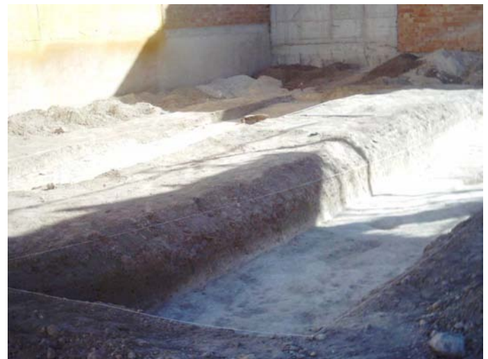
Lámina I. Transects 1 y 2 una vez finalizada la intervención.