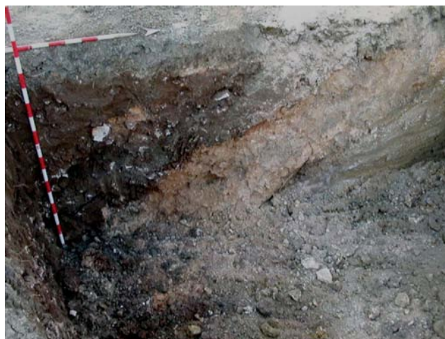
Lámina III. Detalle de los rellenos

Composición: rellenos arenosos de conglomerados calizos de tonalidad blanco amarillento.