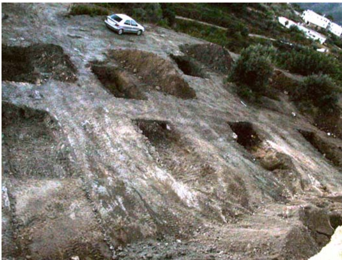
Lámina I. Vista de los cortes realizados