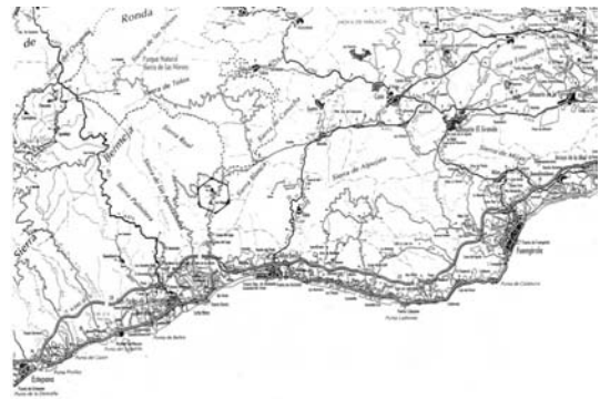
Figura 1. Situación en el plano provincial de Málaga

Los terrenos se encuentran situados en el llano Los Moritos y ocupan las parcelas 101-102 del polígono 7 del T.M. de Istán, (Málaga).