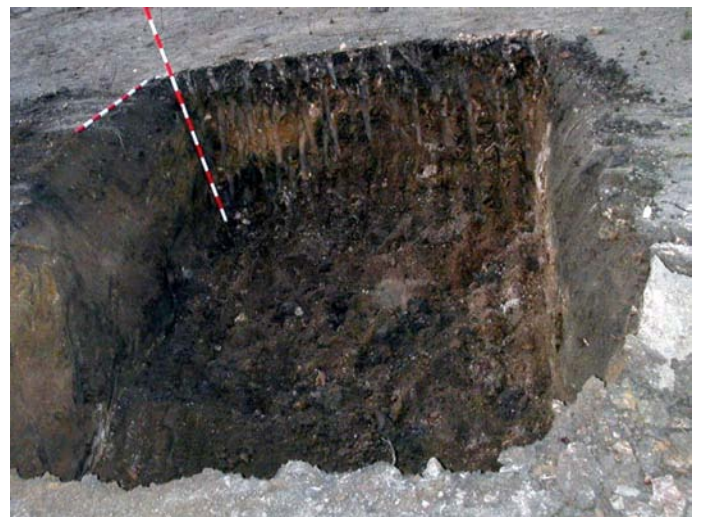
Lámina II. Detalle de uno de los cortes realizados