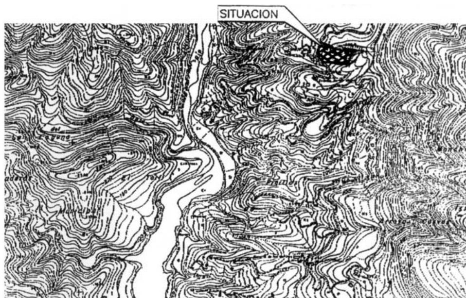
Figura 2. Plano de situación en del solar en el topográfico de Istán