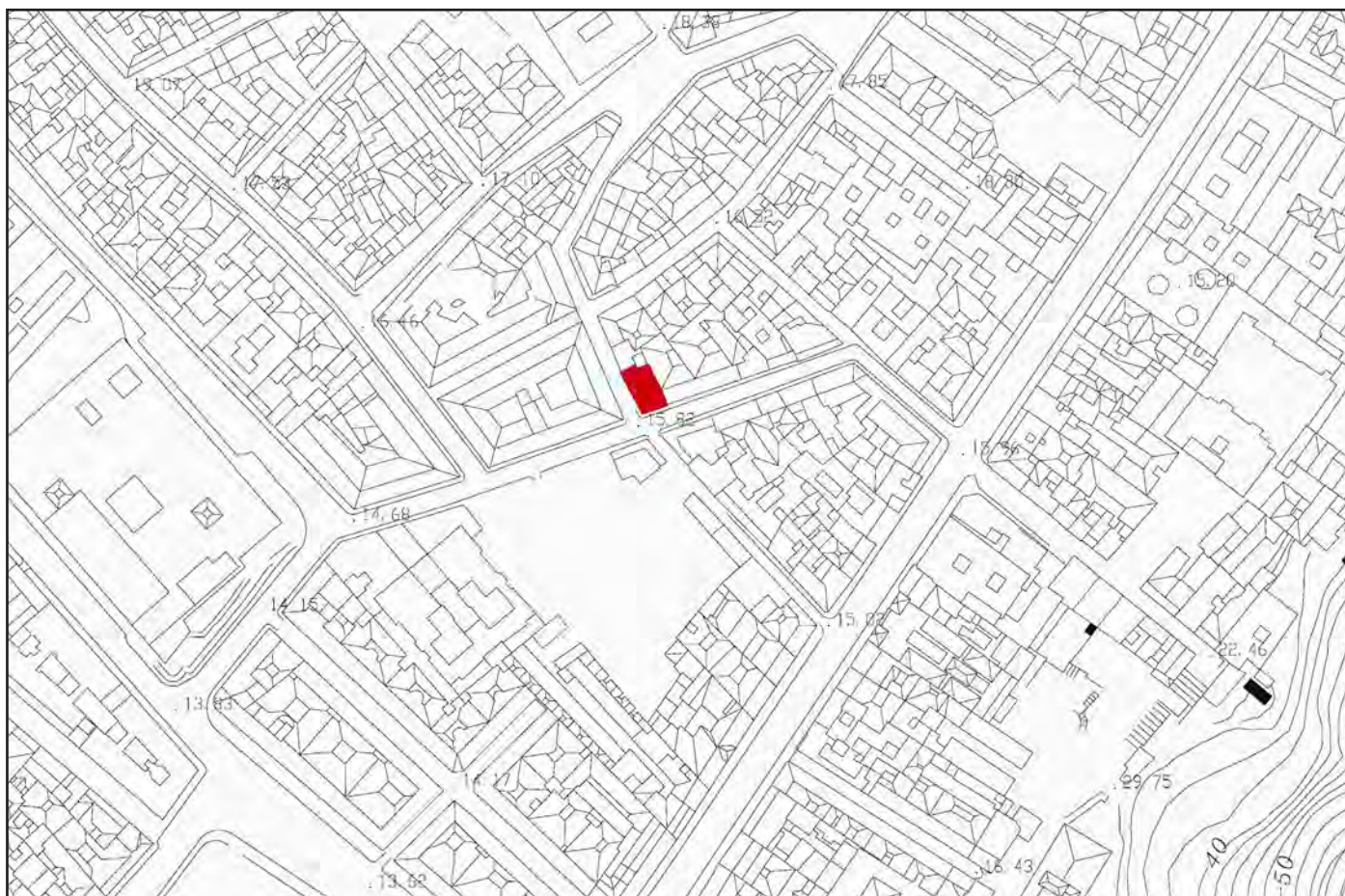
Figura 1. Plano de ubicación del solar