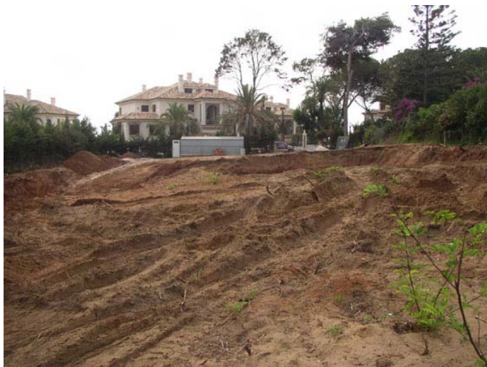
Figura 1. Perspectiva de la parcela desde el este, previa al inicio de los trabajos.