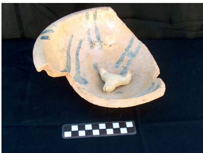
Lámina VI. Plato esmaltado azul sobre blanco, con atifle pegado.

Fase III: Material gráfico perteneciente a la U.E.15