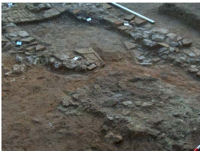
Lámina II. Vista apaisada desde el N. de horno cerámico romano.