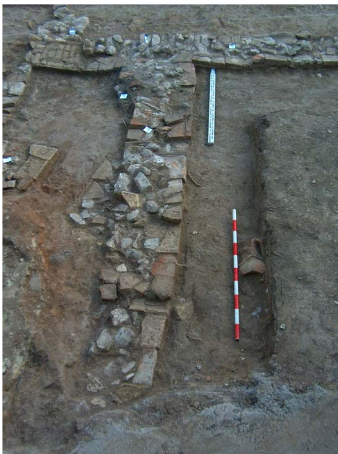
Lámina I Detalle de U.E. 7

FASE I: Material gráfico perteneciente al horno romano.