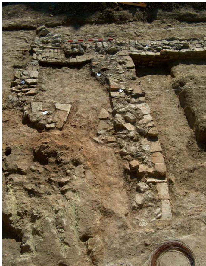
Lámina III. Vista apaisada desde el N. de horno cerámico romano