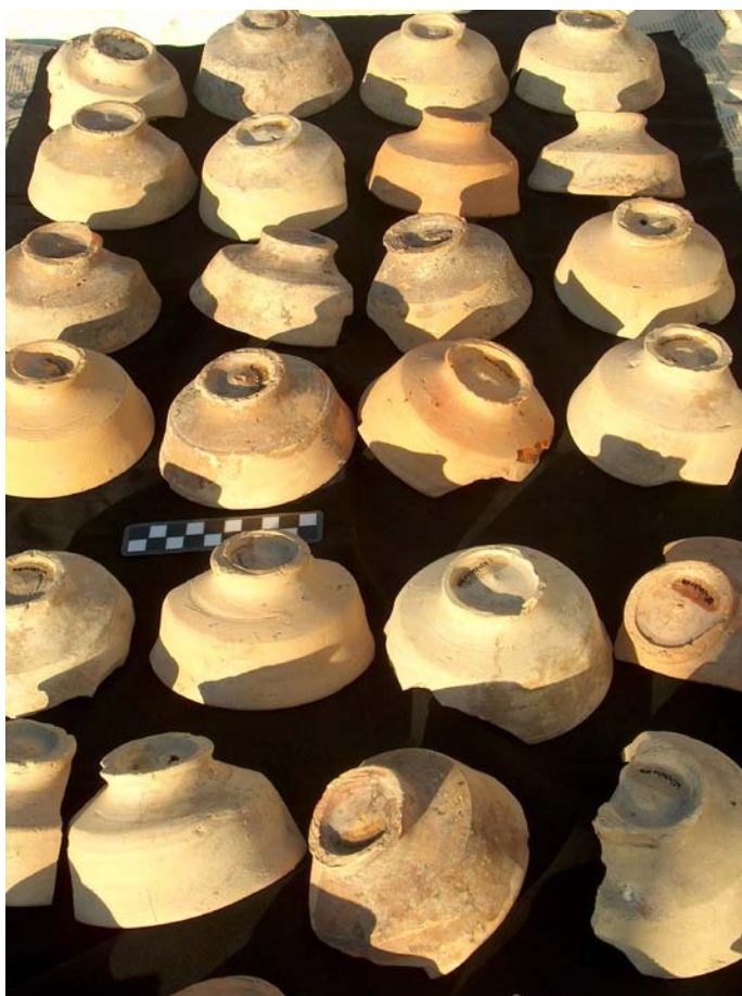
Lámina V. Escudillas recuperadas en la U.E. 4

FASE II: Material gráfico perteneciente a la cerámica recuperada en el testar.