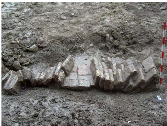
Detalle de arco conservado parcialmente.

Fase III: Material gráfico perteneciente a la U.E.15