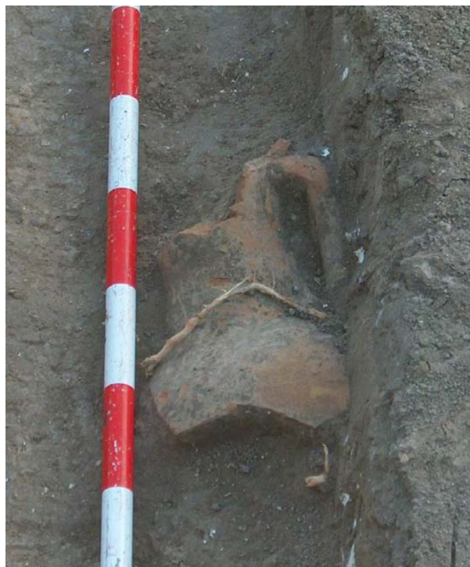
Lámina IV. Detalle de ánfora perteneciente a U.E. 6.