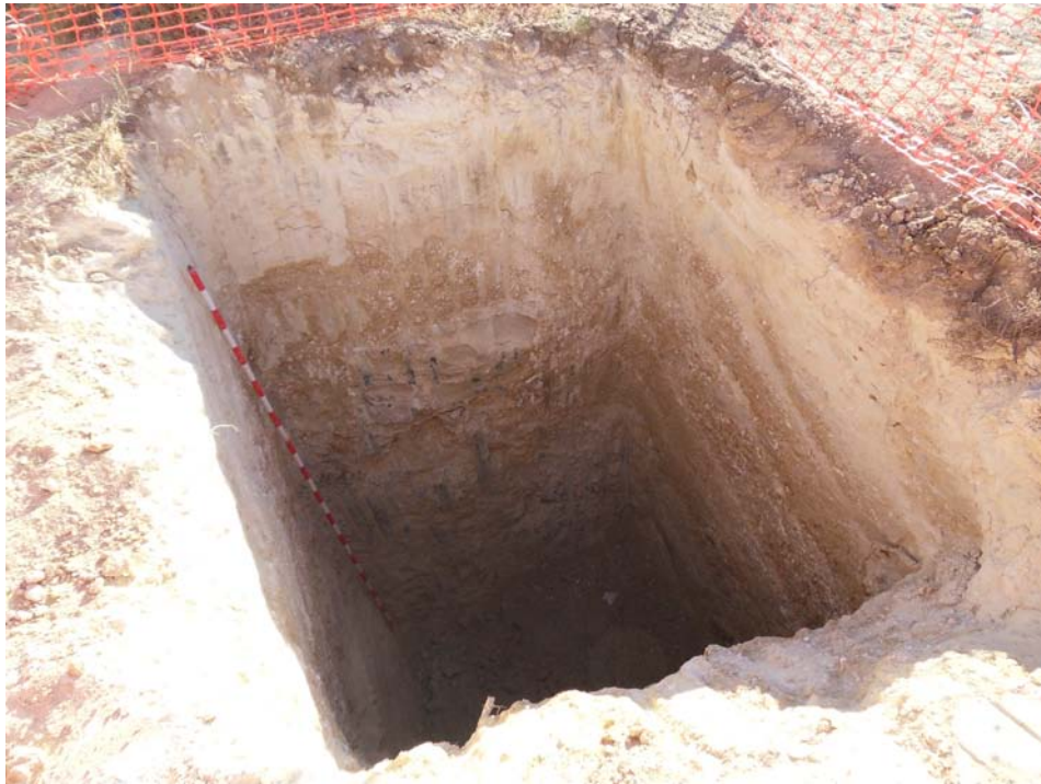
Lámina 1. Detalle de sondeo mecánico nº4