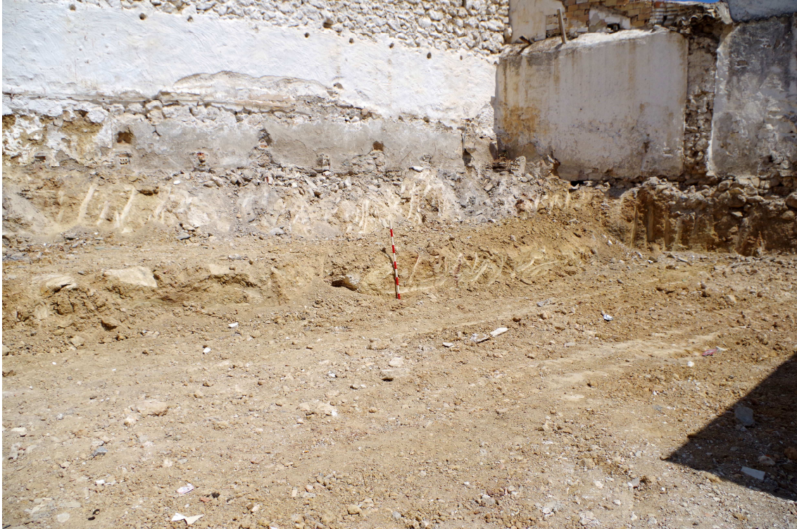
Figura 2. Resultado negativo con la presencia del nivel geológico desde el inicio.