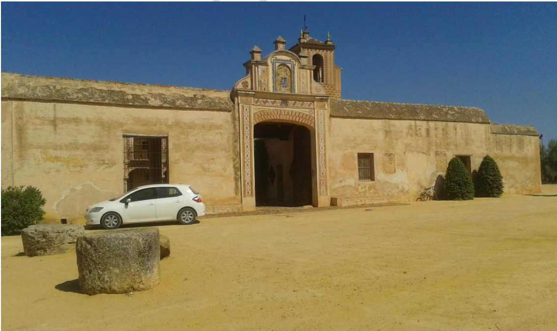
Lámina IV. Vista del patio principal de la Hacienda de Maestre. Las durmientes de las piedras de molino en primer plano.