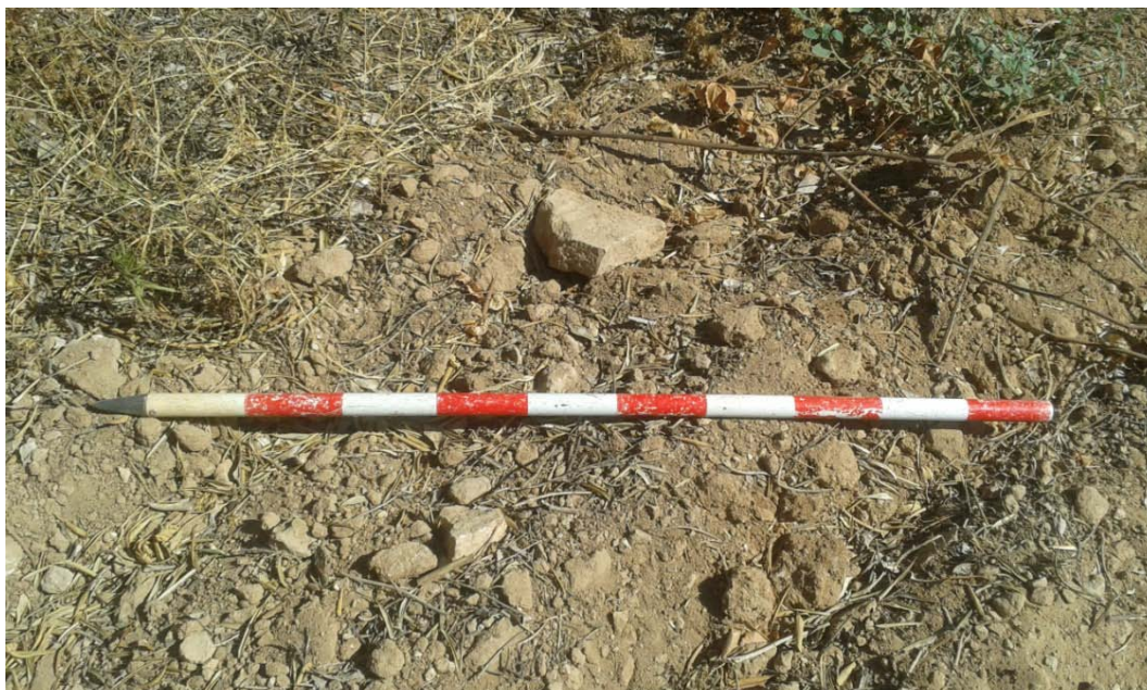
Lámina I. Detalle de los materiales cerámicos del yacimiento Hacienda de Maestre