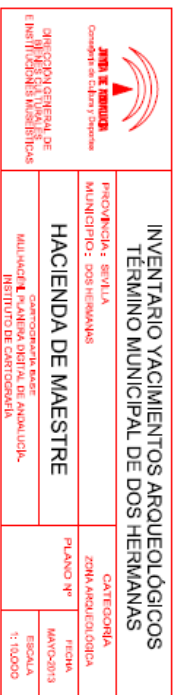
Lámina V. Mapa de localización del yacimiento inventariado 0141038073. "Hacienda de Maestre."