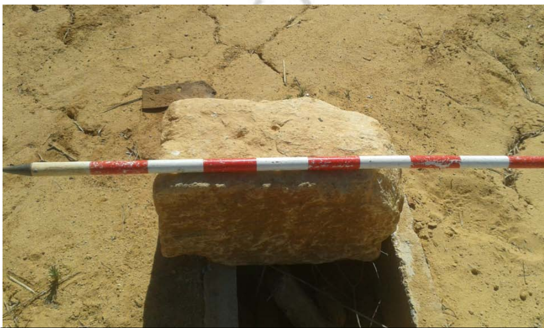
Lámina II. Sillar cubriendo una arqueta de la conducción de cable de alumbrado