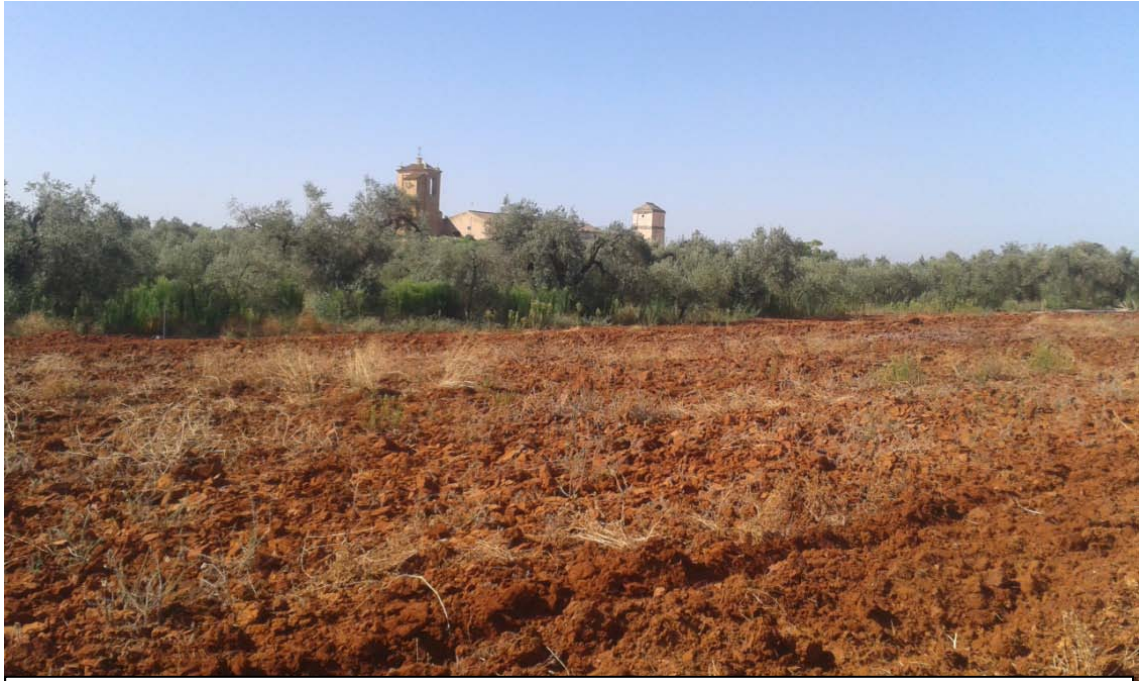
Lámina III. Vista de la superficie prospectada con la Hacienda de Maestre al Fondo.