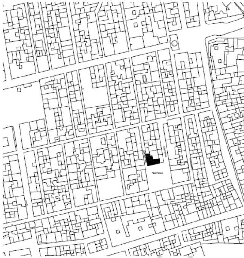
Imagen 2. Plano del emplazamiento del inmueble 3 .

A pesar de su situación dentro del casco histórico de la ciudad, no se documentaron restos arqueológicos durante el control de movimiento de tierras. Ello puede deberse, sobre todo a dos causas: