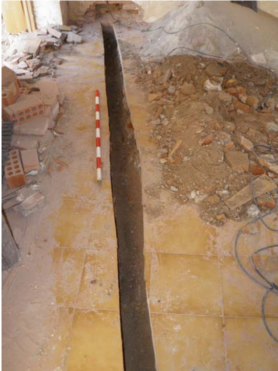
Imagen 7. Parte de la zanja para saneamiento, cuyo ancho era de 12 cm. Su profundidad variaba entre los 13 cm iniciales hasta los 30 cm finales.