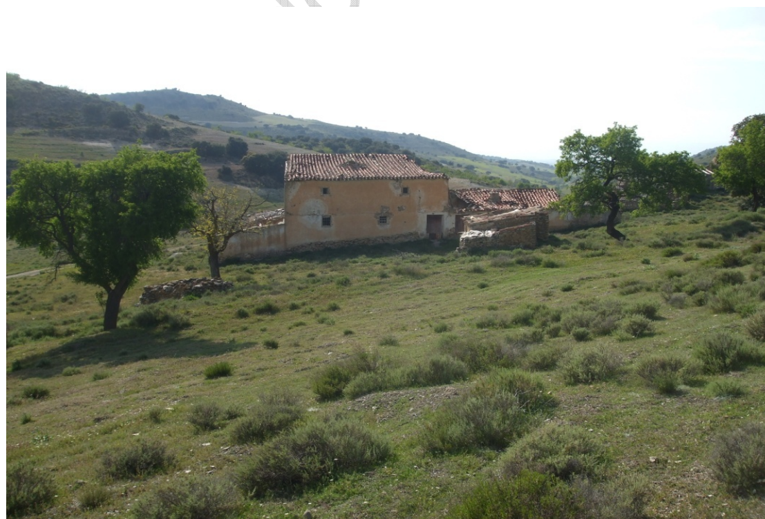
Lám. IV. Cortijo del Cuerpo Humano