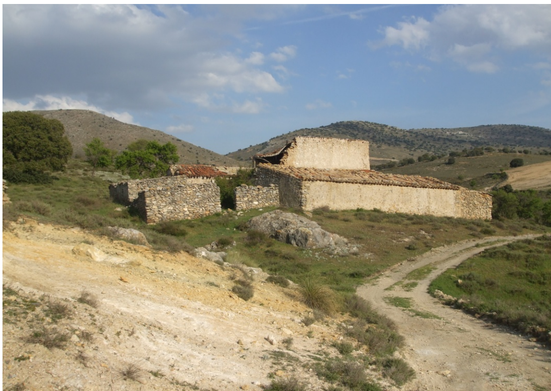
Lám. III. Cortijo de Las Yeseras