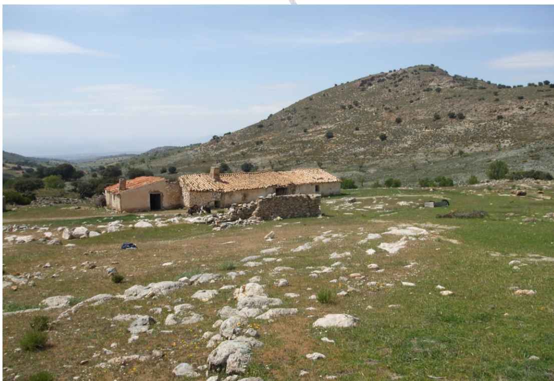
Lám. II. Cortijo de Pellistre