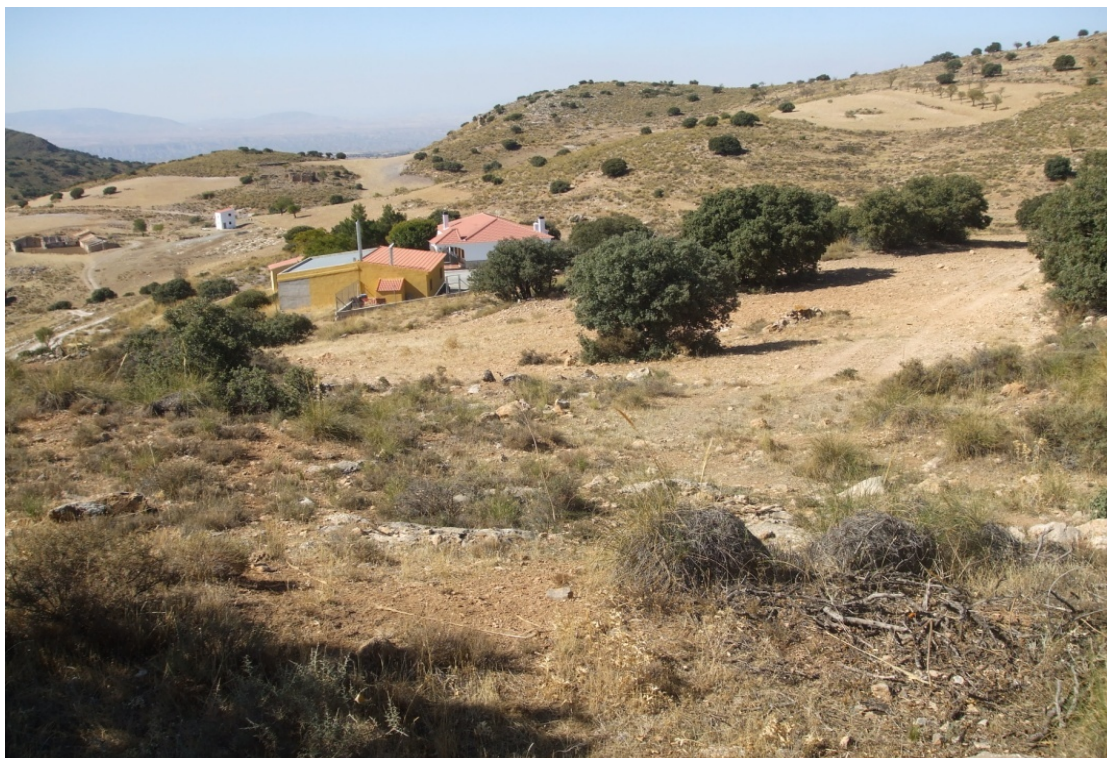
Lám. I. Cortijo del Chato