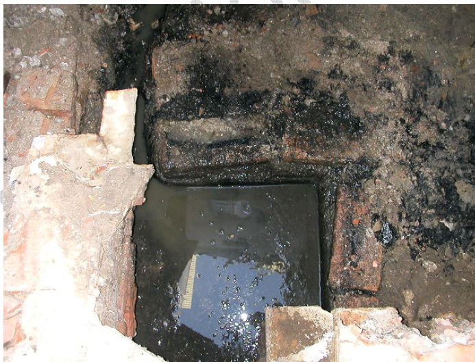
Lám. II; arqueta exhumada

A continuación y en el patio interior de luces se ha procedido a la excavación de un sondeo de 2,00 m x 2,00 m y 1,70 m. de profundidad para ubicación de un ascensor, donde el primer nivel investigado se corresponde con una reforma de la red de saneamiento del edificio en época reciente; mientras que el II nivel investigado está relacionado con parte de la red de saneamiento y cimentación original del edificio existente.