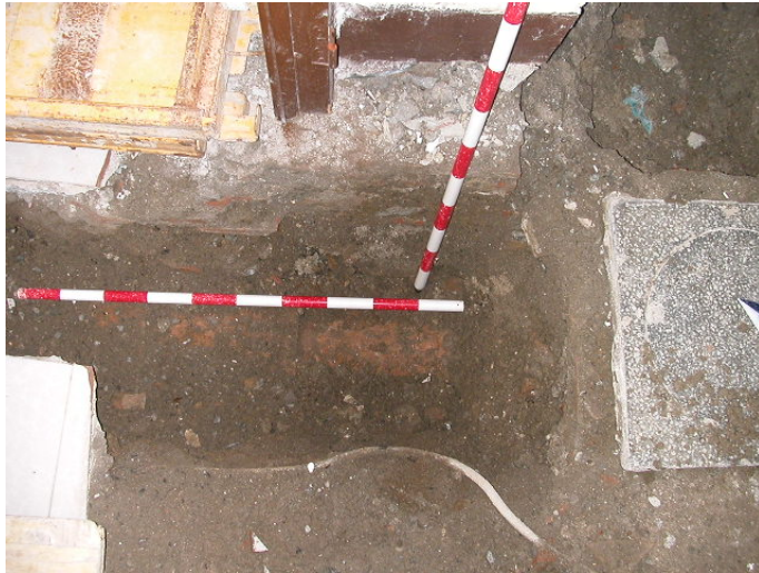
Lám. I tramo de atanor cerámico

A continuación y en el patio interior de luces se ha procedido a la excavación de un sondeo de 2,00 m x 2,00 m y 1,70 m. de profundidad para ubicación de un ascensor, donde el primer nivel investigado se corresponde con una reforma de la red de saneamiento del edificio en época reciente; mientras que el II nivel investigado está relacionado con parte de la red de saneamiento y cimentación original del edificio existente.