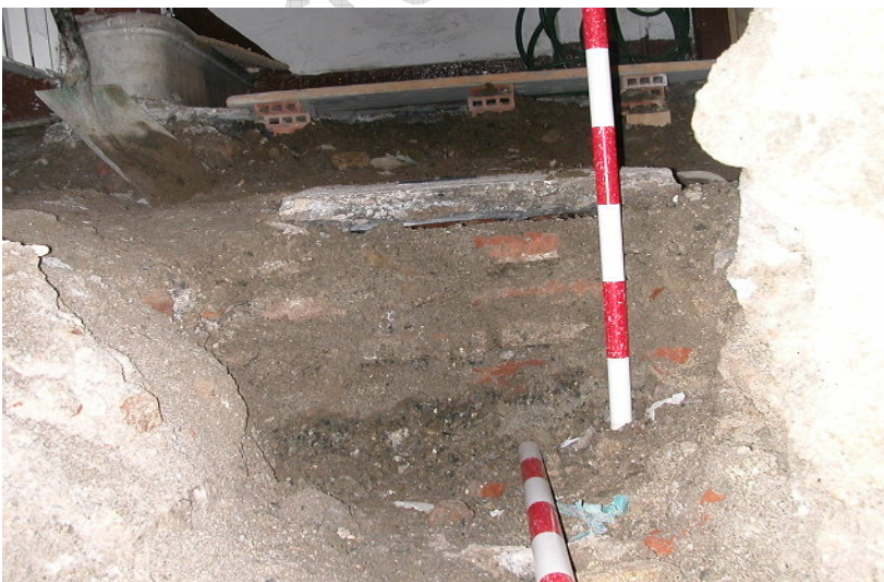
Lám. IV zanja con arqueta