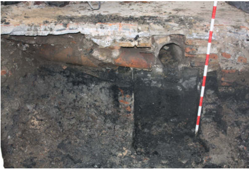
Lám. III; detalle de arqueta y tubo cerámico

Se trata de una atarjea en la que desaguan tres canalizaciones dos de barro organizadas por medio de atanores machihembrados y un una tercera de fibrocemento que en un momento indeterminado debió sustituir a la de barro.