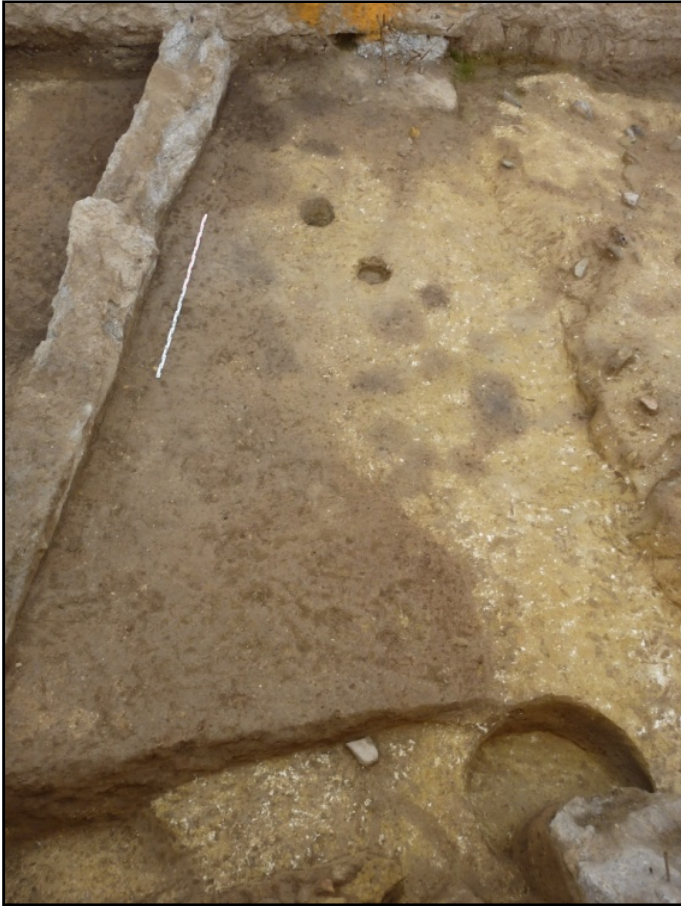
Imagen del sector B.