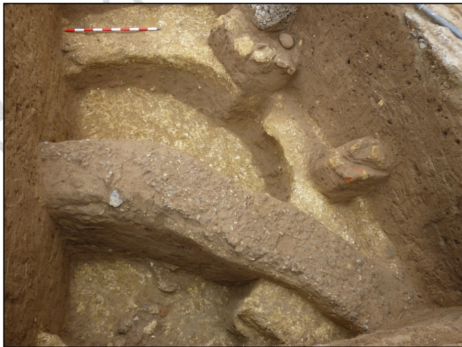
Imagen del sondeo realizado en el sector C