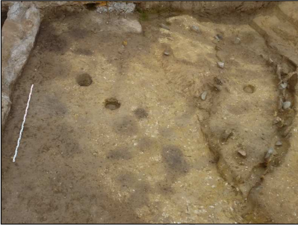
Imagen desde el perfil Sur.