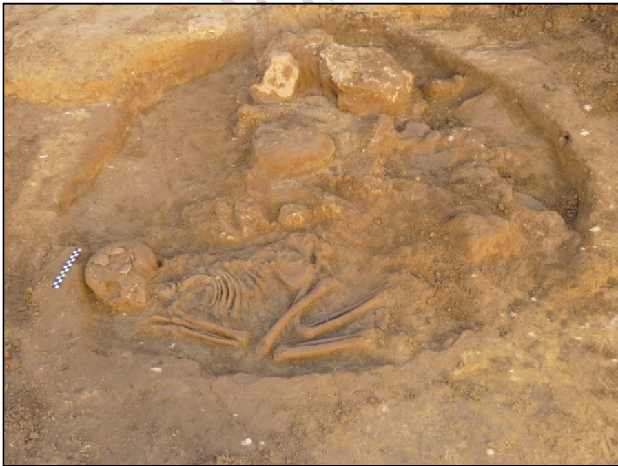
Imagen de los restos humanos