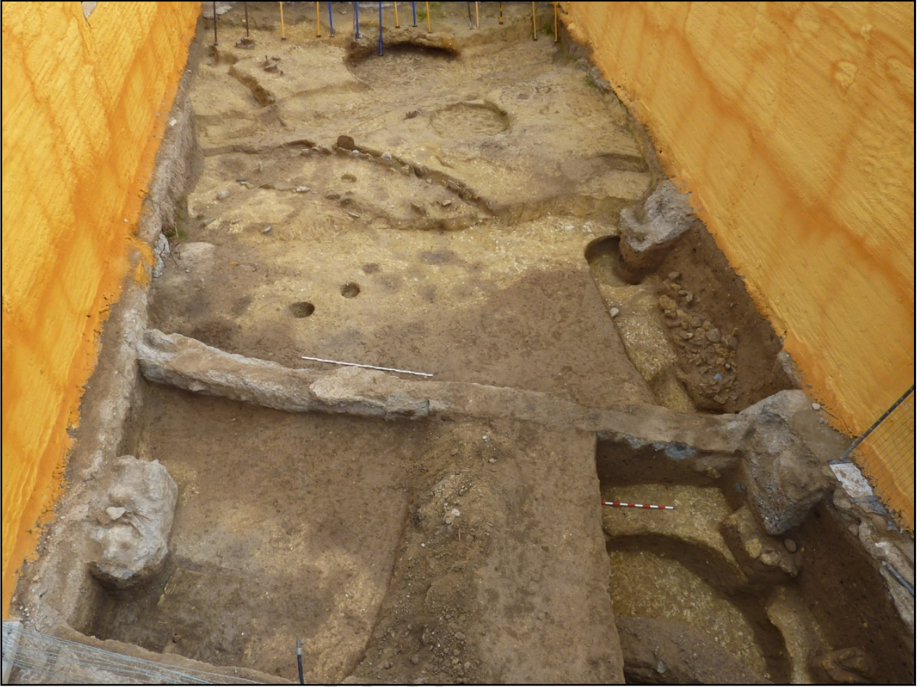
.Imagen aérea de la excavación