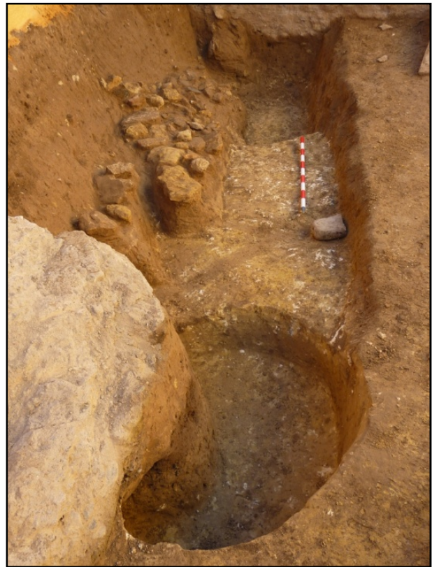
Imágenes del sondeo del sector B