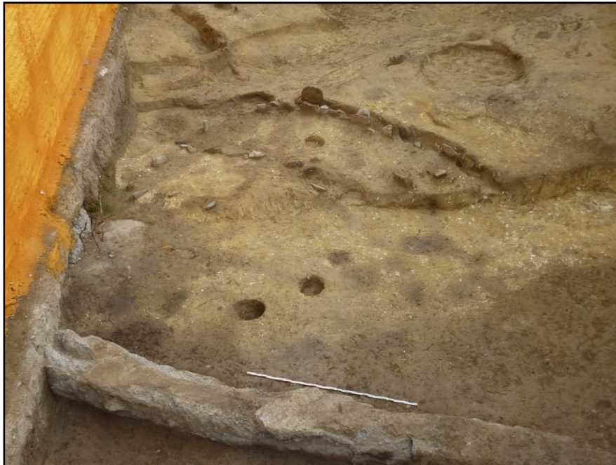
Fotografía aérea de la excavación

De las acumulaciones de carbón vegetal que habían ido apareciendo durante el proceso de excavación se recogieron una serie de muestras con intención de datarlas por medio del radiocarbono. Están en espera de ser enviadas a un laboratorio especializado.