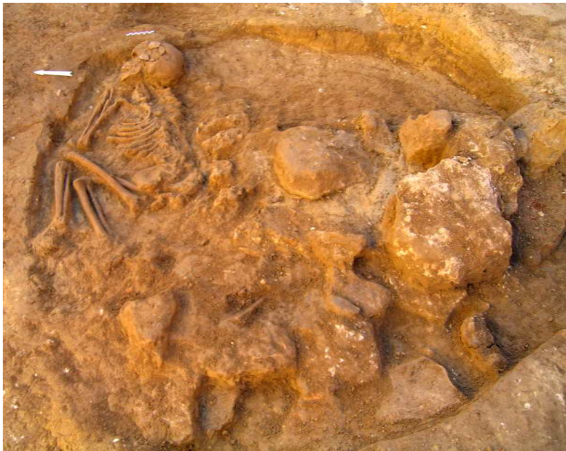
Visión de conjunto de la inhumación, la fosa en la que se hallaba y los bloques de piedra del entorno