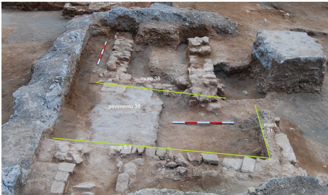
1 Estancia D. Vista general.

El muro 5.1 forma una crujía hacia el oeste con un muro de la misma factura, tapial y base de mampuesto, que corresponde a la u.e 31. Este muro queda cortado por un dado de hormigón en su desarrollo oeste.