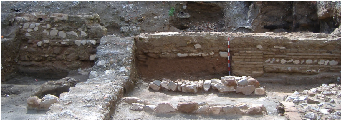
Corte 1. Sector Calle Eslava. Alzado interior de la cerca del arrabal

De esta manera se observó una amplia muralla sustentada en una firme base, alternando trazas de mampostería y ladrillo, y potentes alzados de tapial con trayectoria Norte-Sur, siguiendo la ribera oriental del conocido como Arroyo del Cuarto, con el que lindaba al Oeste.