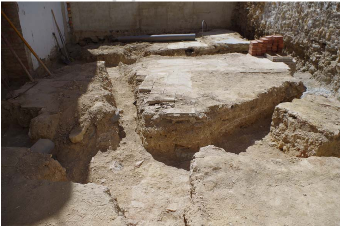
Lám. 1. Foto final de la actuación.