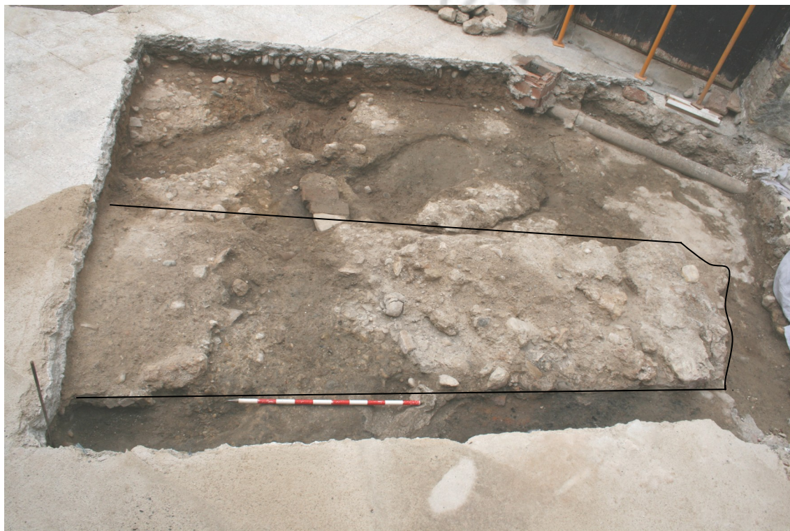
E-003.-Cimentación de la cerca sector 01

Los restos pertenecientes a la cerca (E-003), se localizan en el sector 01 y, en menor medida, en el sector 02. Se trata de un tramo recto, con una orientación NO-SE, continuación del ya localizado, por lo que discurre en paralelo a la cara SO de la Torre.