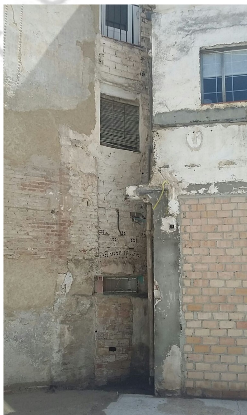
Detalle de la esquina intervenida

Durante la intervención se ha comprobado que esta estructura se adosaba a la esquina de la torre. Al retirar este muro tabique se pudo comprobar que la torre no ha sufrido daños.