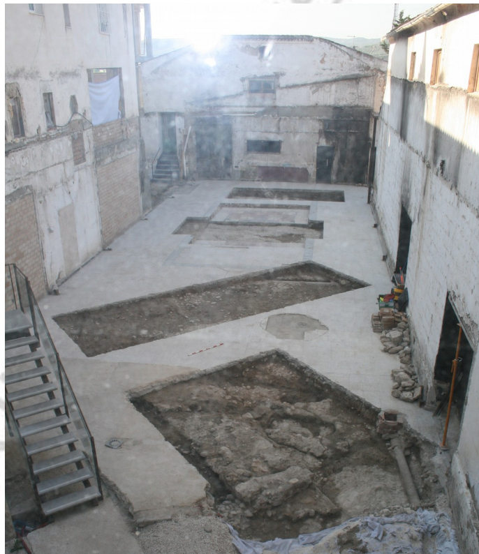
Ubicación de los sondeos en el solar