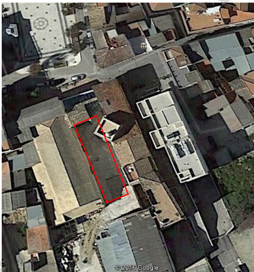
Ubicación de la Torre y la parcela en el núcleo urbano

Según el Diccionario Madoz 1 (1847) el pósito de Huétor Tájar contaba en 1830 con 3.092 fanegas de trigo y 664 fanegas de regadío.