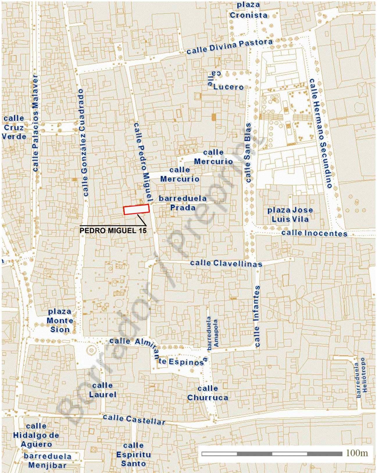
LÁMINA 1: Localización de la parcela en su entorno urbano.