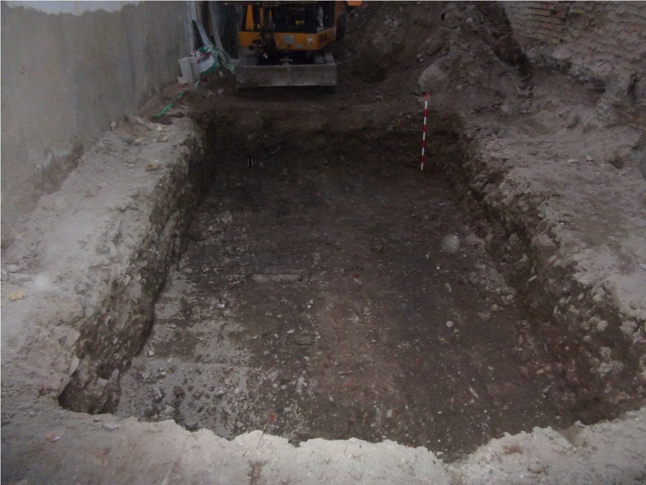
LÁMINA 3: Sondeo arqueológico en la zona interior de la parcela.