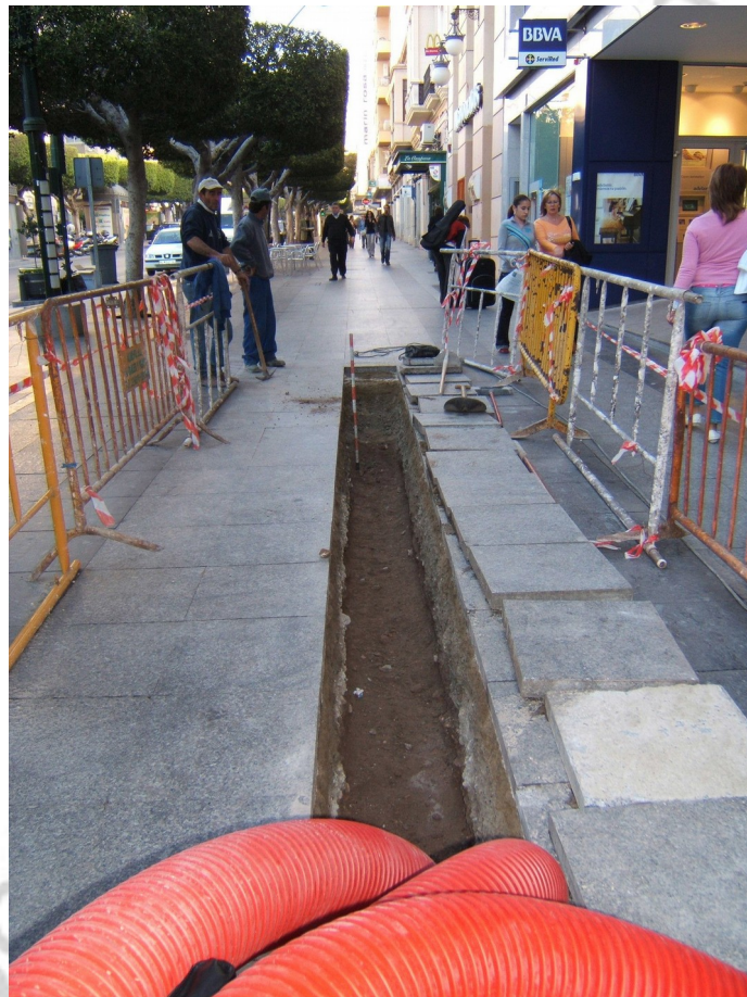
LÁMINA II.- Zanja para suministro eléctrico. Contexto de época Contemporánea.