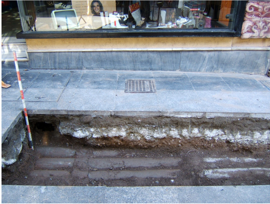
LÁMINA I.- Zanja para suministro eléctrico. Detalle.