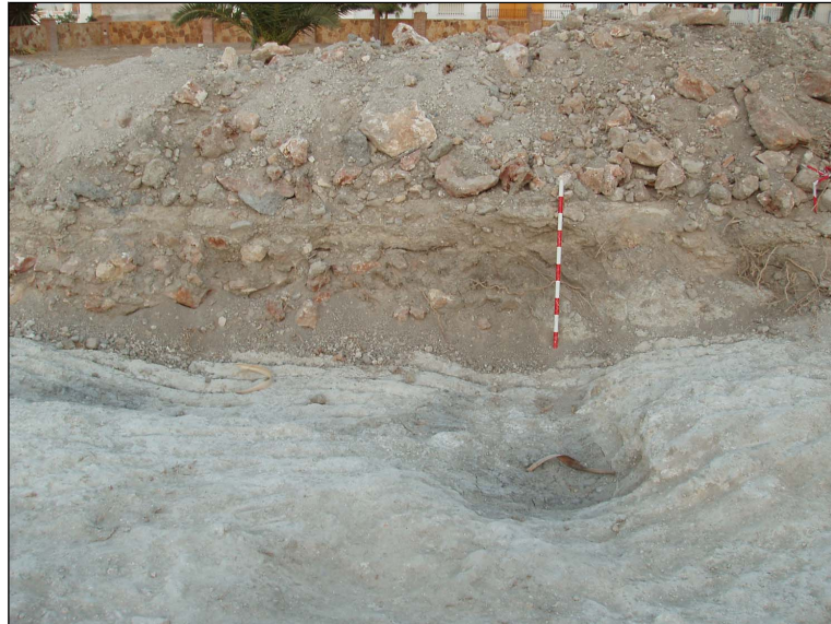
Perfil Sur Ue. 1 rellenos sobre el nivel geológico.

La Ue. 1 se trata del terreno superficial existente en toda la parcela caracterizándose como arenas finas, en sectores de la parcela mezclados con restos de materiales de construcción, seguramente debidos a la reciente demolición de la edificación preexistente. En otras zonas del inmueble se define como humus orgánico, lógicamente para los jardines circundantes a la casa de recreo.