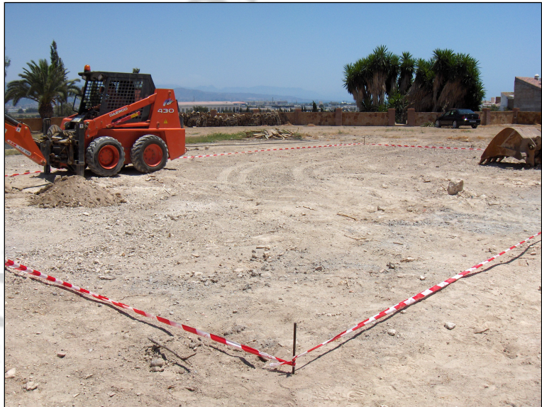
Lamina 3: Solar previo a la intervención.