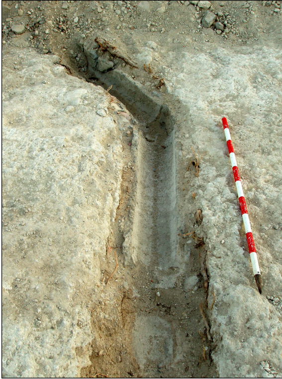
Inserción canalización en el mismo.l

Reseñar por último que este sustrato geológico de base (Ue. 5) está conformado por los travertinos que se han venido reseñando.