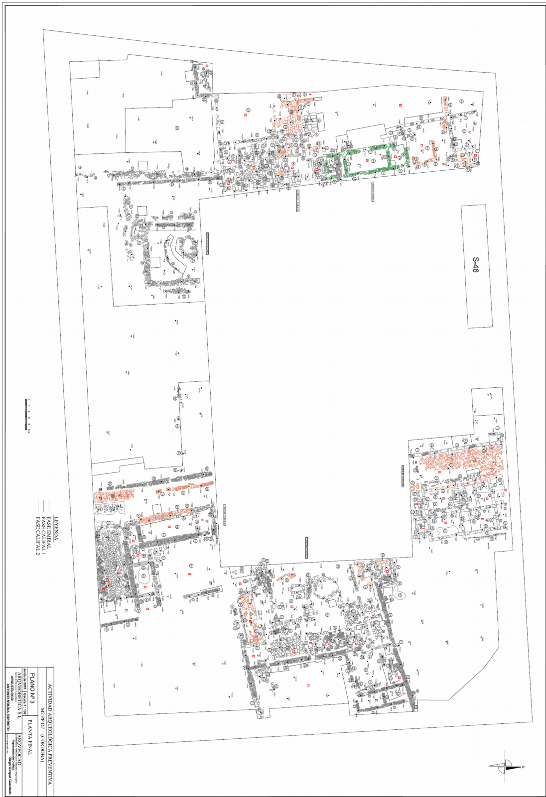
Fig. 2. Planta general excavación