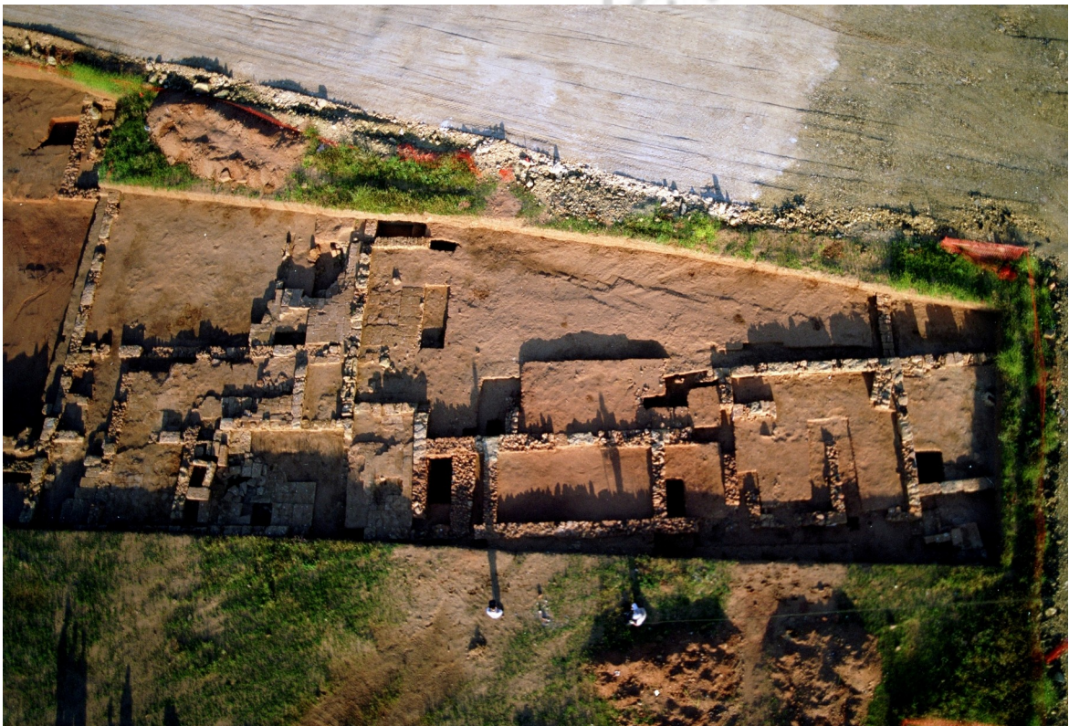
Lám. 2. Vista aérea del Edificio Califal 1