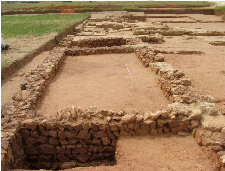
Lám 8. Vista general Edificio Emiral.