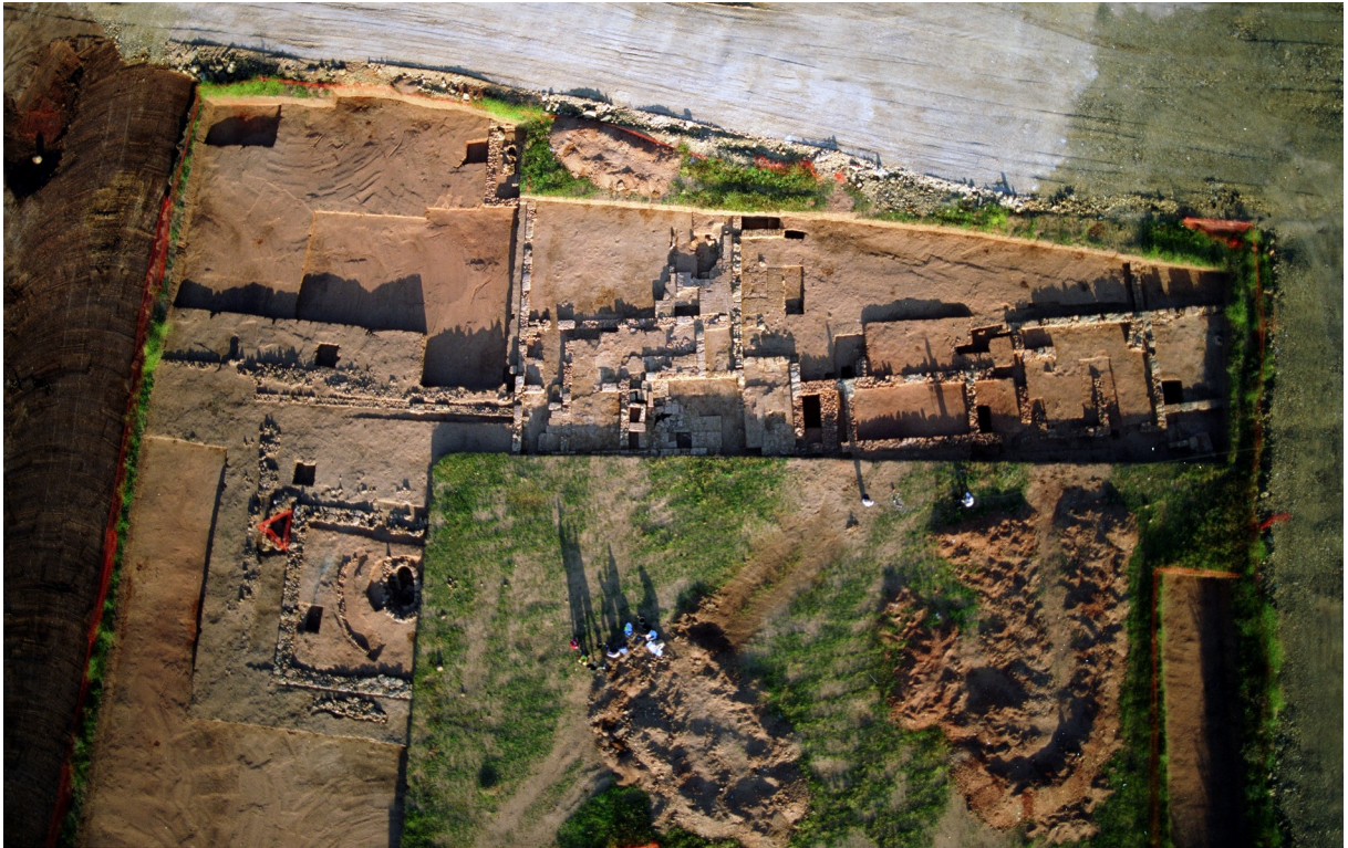
Lám. 3. Vista de los Edificios 1 y 2 Califal (complejo Oeste).