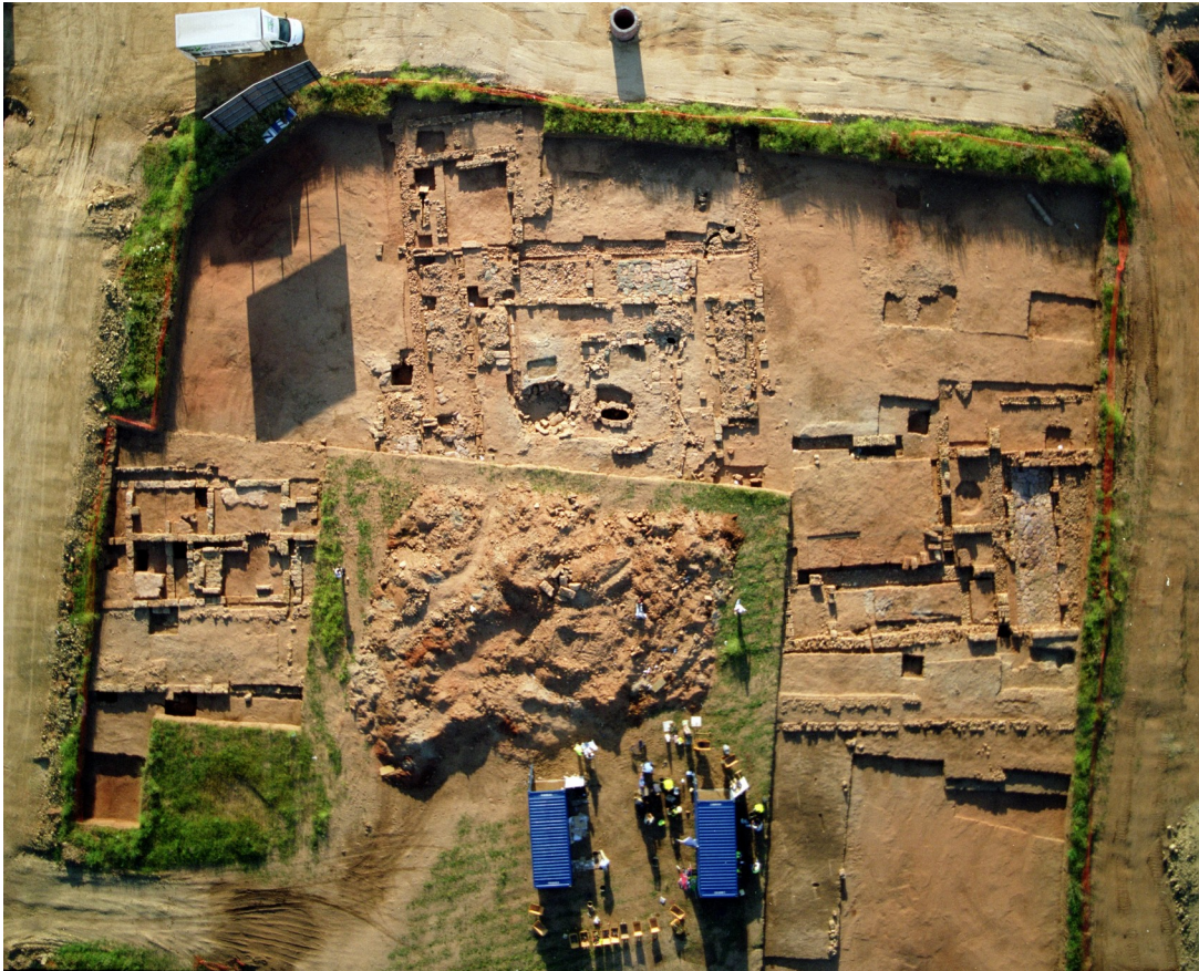
Lám. 7. Panorámica general del complejo Este.