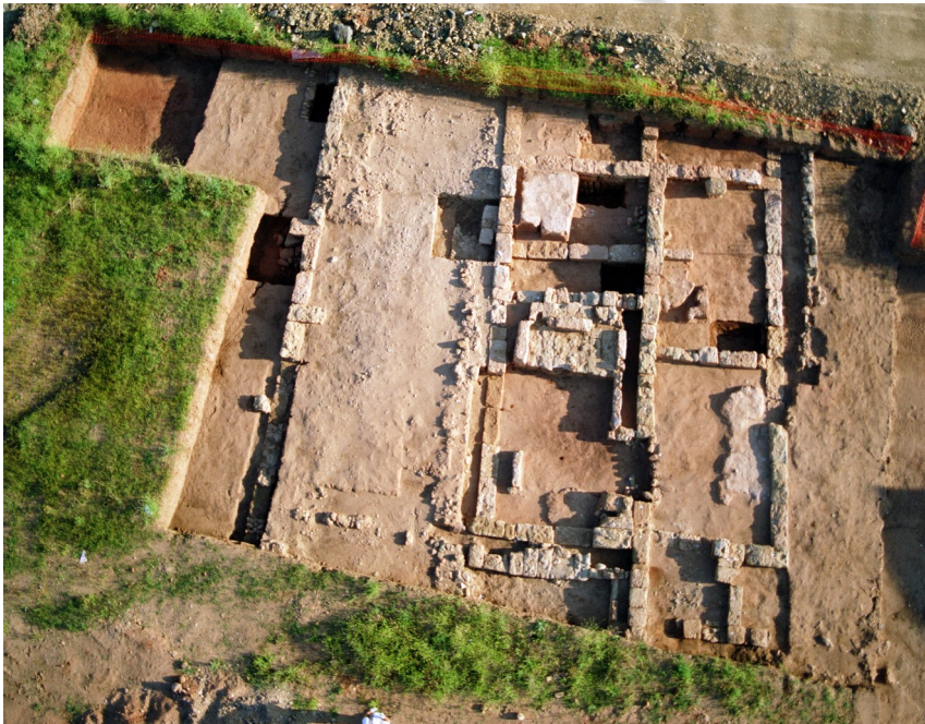
Lám.6. Vista general Edificio 5 Califal