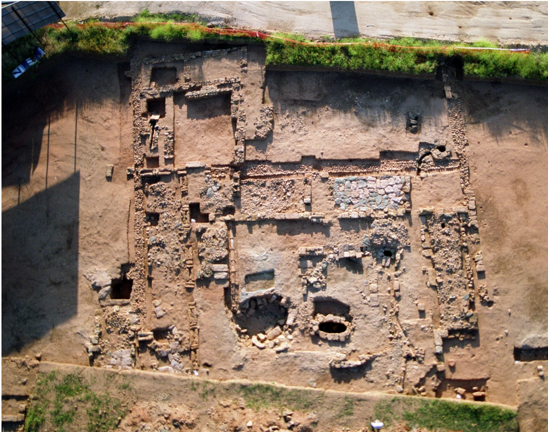
Lám. 5. Vista del Edificio 4 Califal.