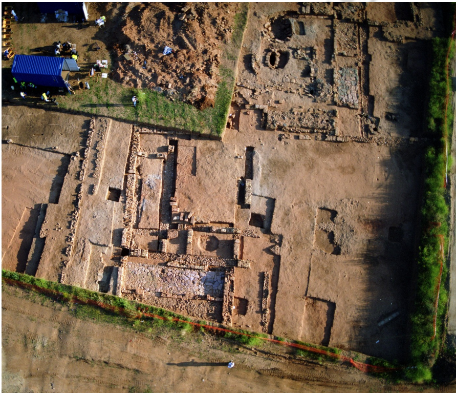
Lám. 4. Vista del Edificio 3 Califal.