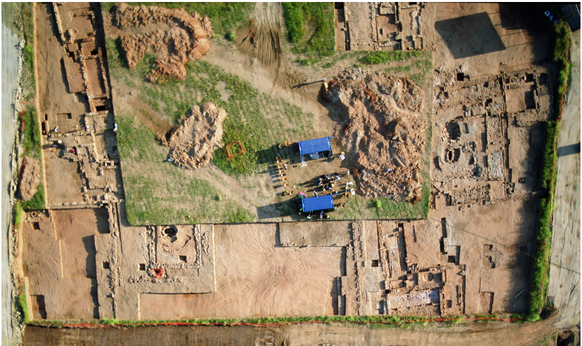
Lám 1. Vista aérea de la excavación de la Manzana 2 del Plan parcial O-7