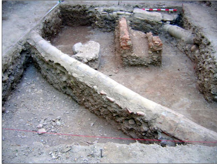
Foto: Vista parcial del sondeo una vez finalizados los trabajos de excavación.

En el solar quedan reflejados los acontecimientos de los últimos años en el barrio. El ritmo elevado de nuevas construcciones tanto en época actual como contemporánea han arrasado con la práctica totalidad de los restos arqueológicos. Si bien pueden observarse indicios de la necrópolis islámica en la zona por los materiales reutilizados en las obras de nueva factura. También se observa que en las viviendas de época moderna es más usual localizar la necrópolis de Puerta Elvira debido a que los métodos de rebaje y construcción de esa época eran menos agresivos que los actuales.