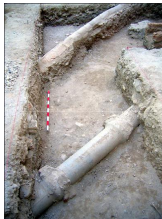
Foto: vista de las canalizaciones de fase contemporánea.

La primera: Se corresponde con las estructuras E-2 y E-3. Ambas están asociadas a la construcción de la vivienda demolida, correspondiendo a su red de saneamiento. Asimismo podemos asociar a la construcción de la vivienda el rebaje en el nivel geológico relacionado con la fosa de cimentación de la misma, y los rellenos UEN 002 y 003. Utilizados para la nivelación en la construcción ya que los escasos materiales documentados en ellos eran de época contemporánea (plásticos, ladrillos huecos, vidrios de botellines, etc.) salvo alguna laja de pizarra y resto óseo procedente de la destrucción de la necrópolis.