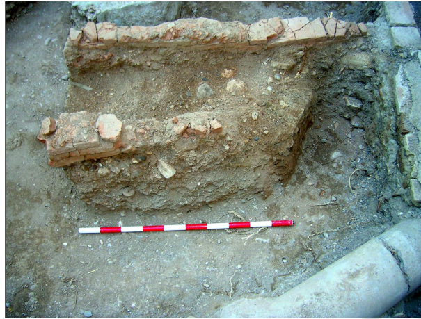
Foto: detalle de la sepultura CEF-1 una vez retirado el individuo.

seccionada por las canalizaciones contemporáneas y por el rebaje practicado en el nivel geológico para la fosa de cimentación de la vivienda.