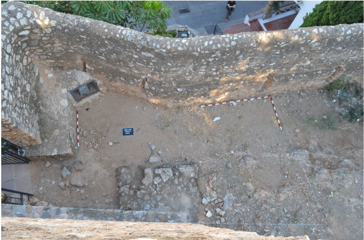
Lám. 1. Foto de inicio con UE1