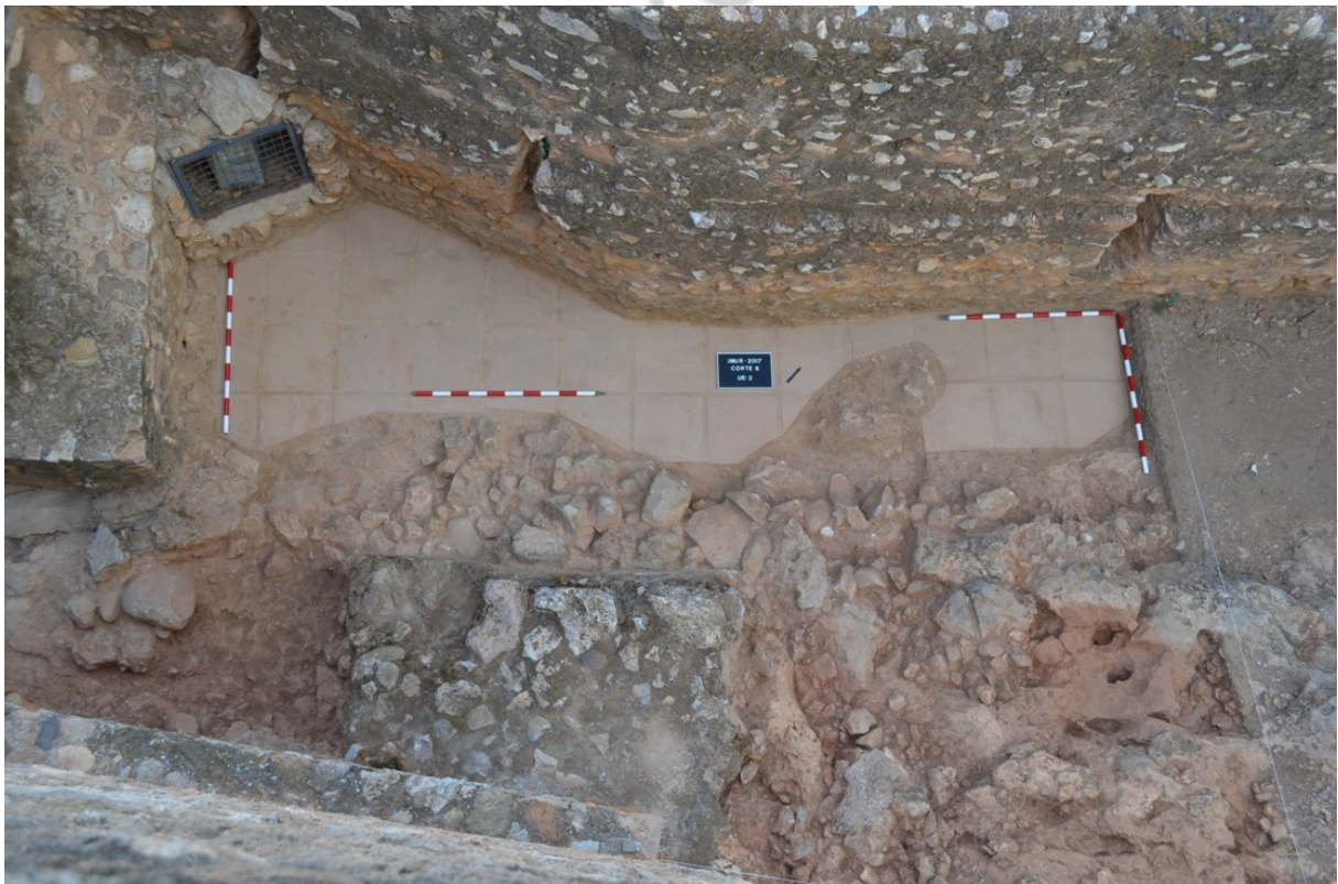
Lám 2. UE 2; Solería de barro de época contemporánea