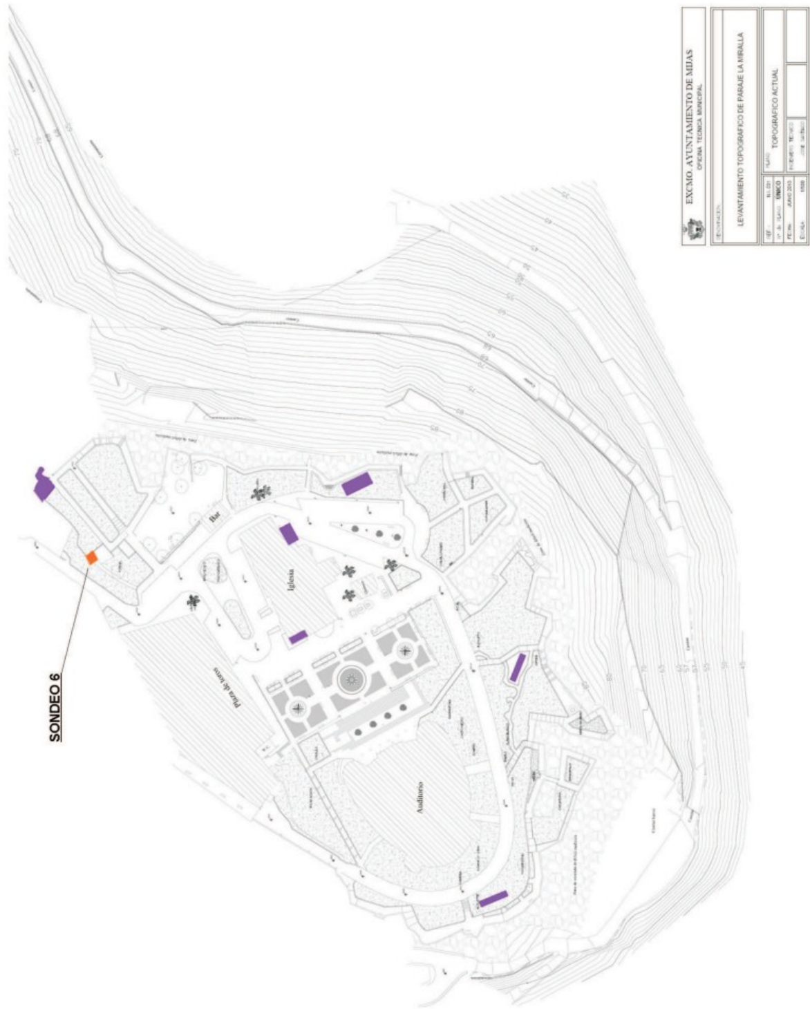
Fig. 1. Plano de situación de la actividad arqueológica realizada