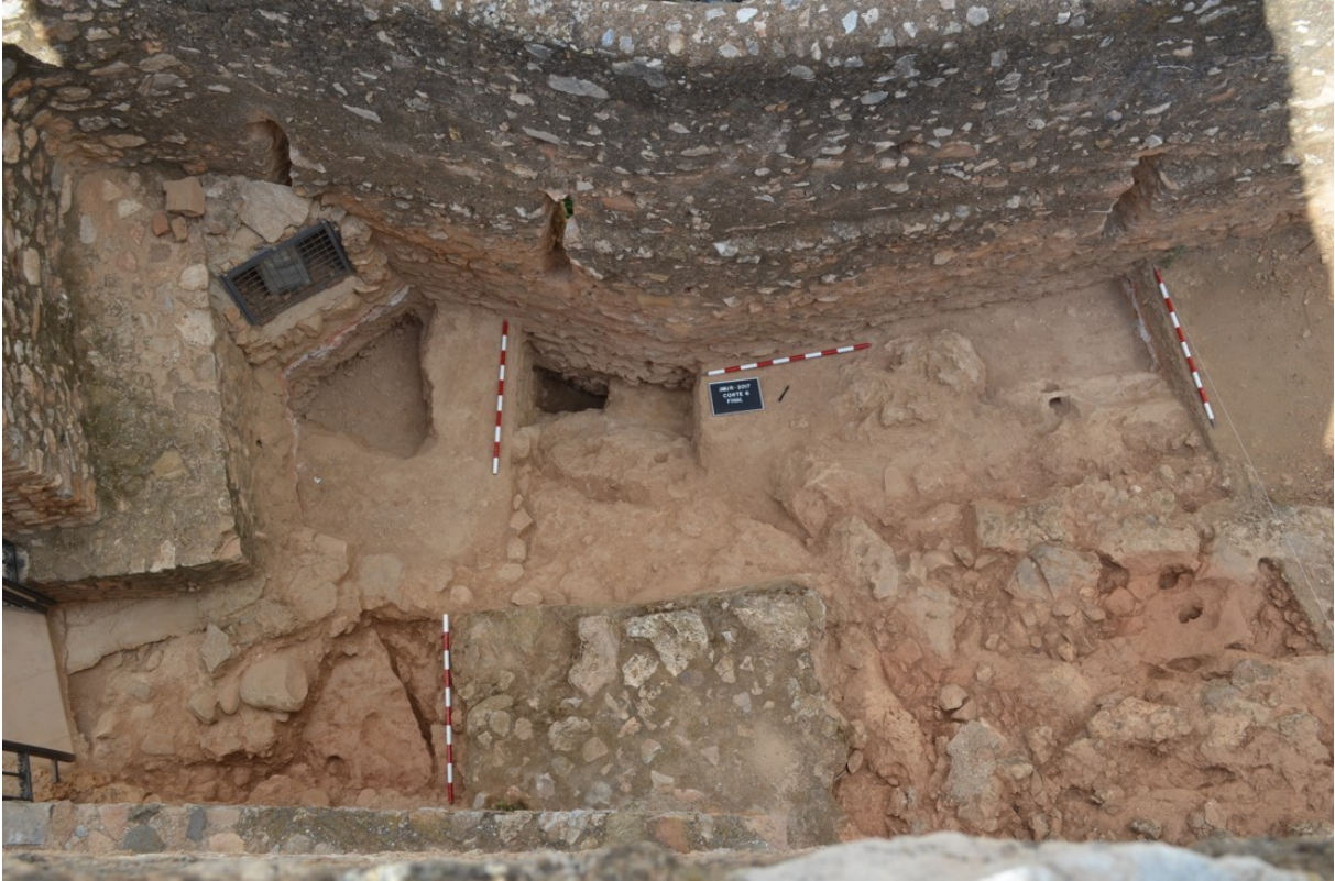
Lám. 5. Foto Final