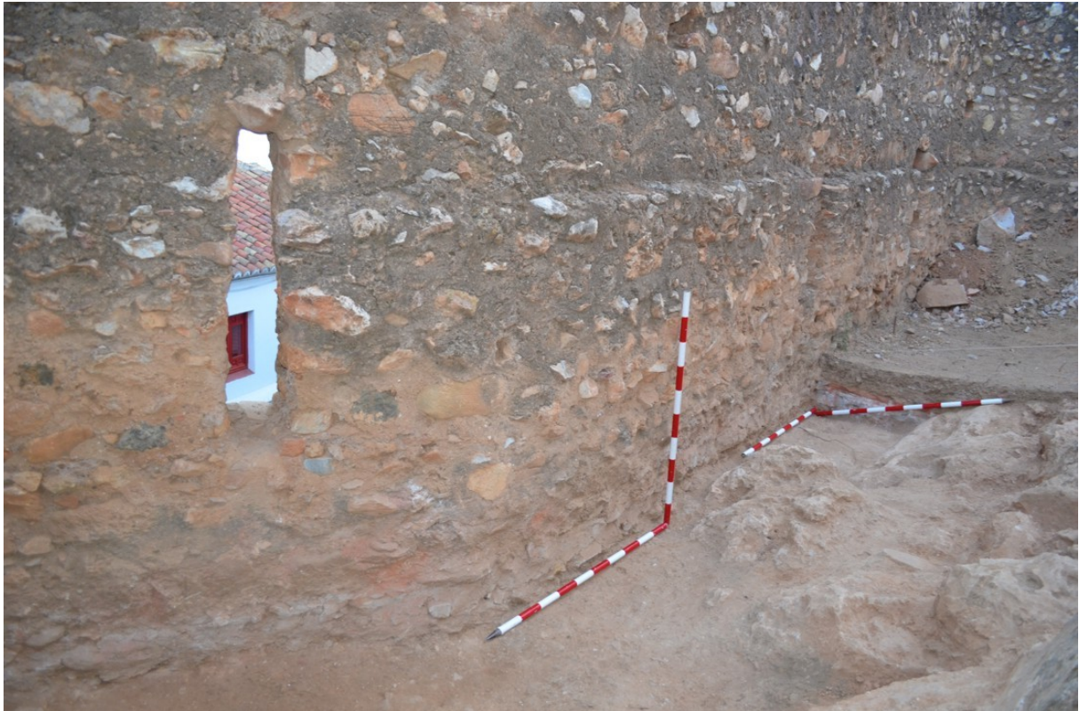
Lám. 3. UE7; Suelo de tierra apisonada entre el travertino y el lienzo de muralla