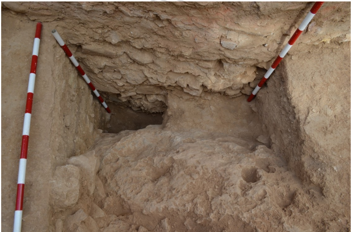
Lám. 4. Sondeo bajo UE7 con lienzo de muralla (UE9 a UE13)