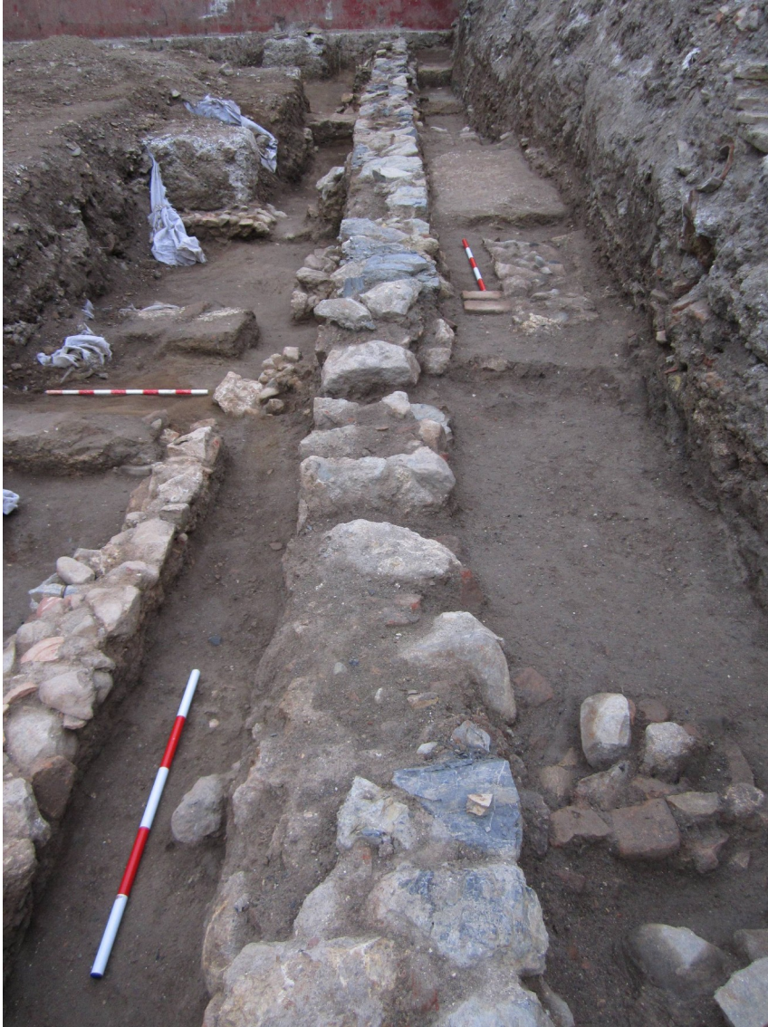
Lám. IX. Cadena de cimentación ue D1