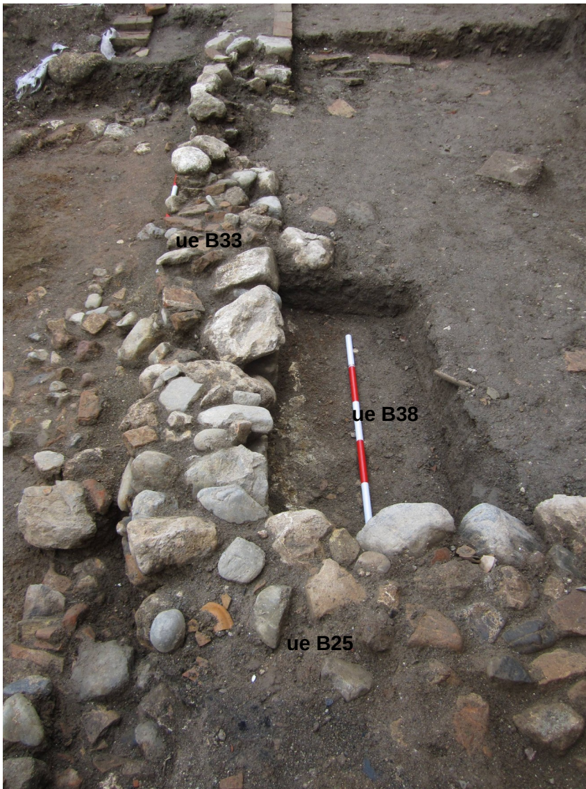
Lám. II. Suelo ue B38 asociado a los muros uuee B33 y B25

- B38 . Restos de un suelo de mortero de cal, asociado a los muros B25 y B33. Colmatado y roto por B36