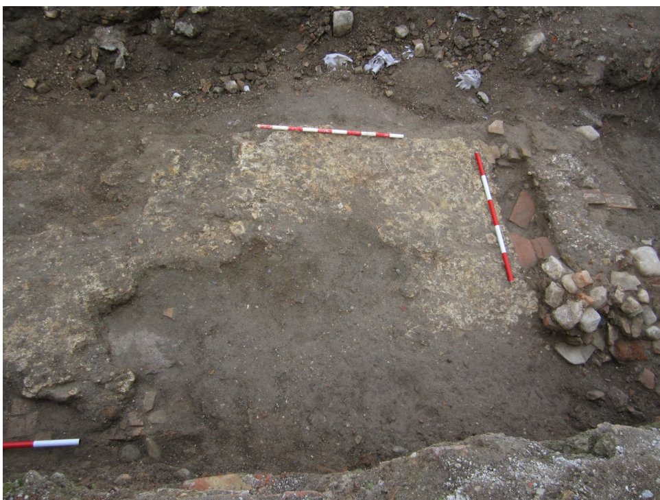
Lám. VII. Restos de la primera unidad.

A19. Suelo de mortero de cal que conserva, embutido en él, restos de una canalización de ladrillo (A19b), en su zona oeste.