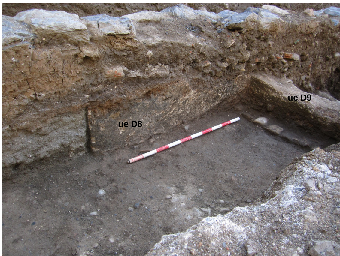
Lám. III. Muros D8 y D9

A unos metros al sur de este conjunto aparecieron dos muros de tapial, unidos en su esquina noreste, bajo una fase posterior de mampostería. No parecen formar parte del mismo ámbito estructural que los muros anteriores, aunque por su construcción y cota son coetáneos. Se trata del muro D31: