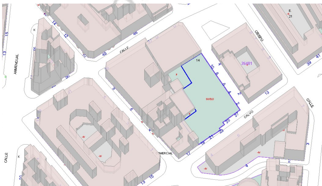
Fig. 1. Situación de la UA-16 según planimetría del catastro.

La actividad se adapta a los objetivos que se persiguen y a los criterios establecidos para este tipo de intervenciones