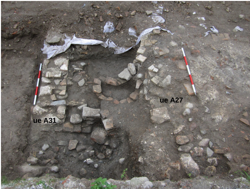
Lám. VI. Calle con sus saneamientos colectivos.

Al otro lado de la calle, hacia el oeste, tenemos una sucesión de restos de muros y suelos asociados a ello sin una clara división entre unidades habitacionales. Si seguimos la línea de la excavación primera, tendríamos hasta 3 unidades.