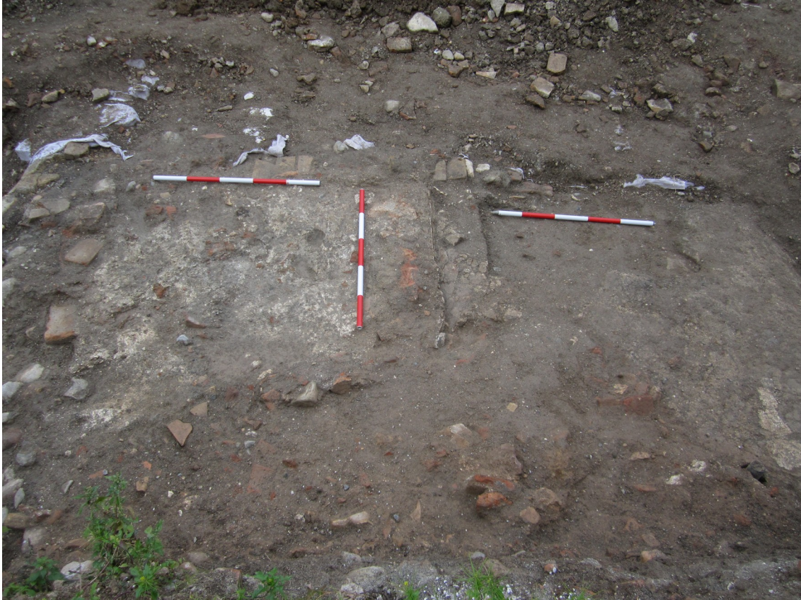
Lám. V. Suelos A32 y A37 separados por el muro de tapial A35.

Los muros de cierre A31 y A27 definen un espacio intermedio que se ha interpretado como calle. En él se localizan varios pozos negros y canalizaciones (éstas parten de las casas laterales y vienen a morir aquí).