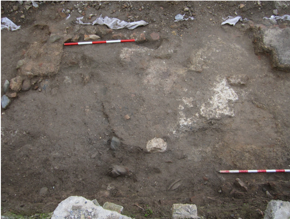
Lám. VIII. Restos del suelo A14 y los dos pilares (cada uno en una esquina de la parte superior de la foto)

De la tercera unidad no nos quedaba mas que un suelo de mortero de cal (ue 8). Aunque en la esquina suroeste del solar nos aparecieron varias canalizaciones (A4 y A5) y un par de estructuras (A3 y A6) que interpretamos con fuentecillas, quizás asociadas al patio de esa tercera unidad.