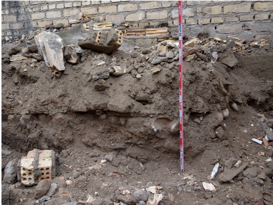
Fig. 1. Estratigrafía registrada.

pozo ciego y una arqueta de saneamiento. Estos niveles se sitúan entre las cotas 103,30/103,10 m.s.n.m.(cota de replanteo de la cimentación)