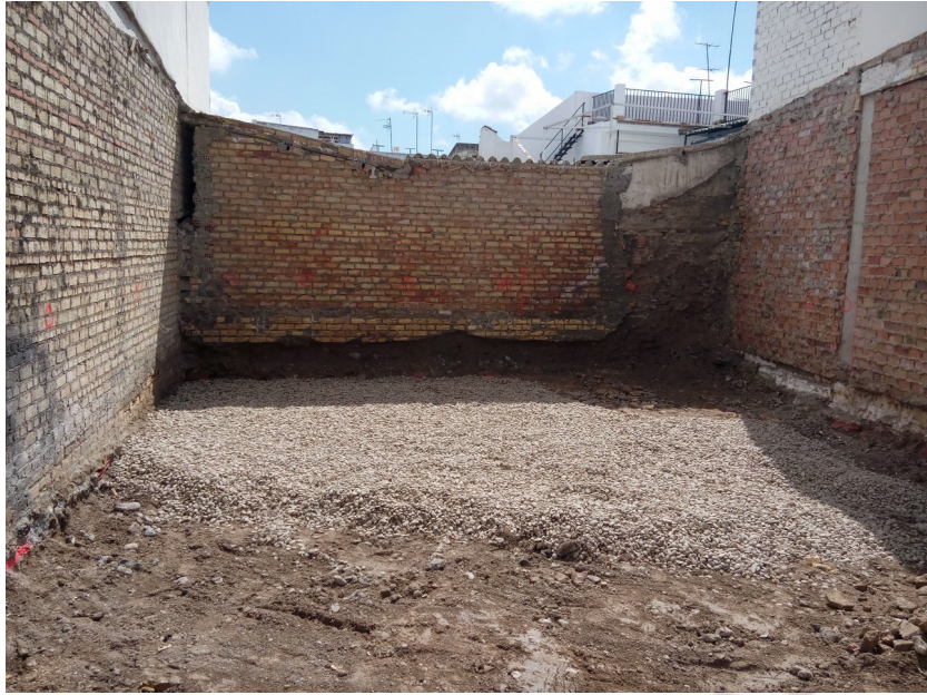
Fig. 3. Vista de la parcela una vez concluidos los trabajos.