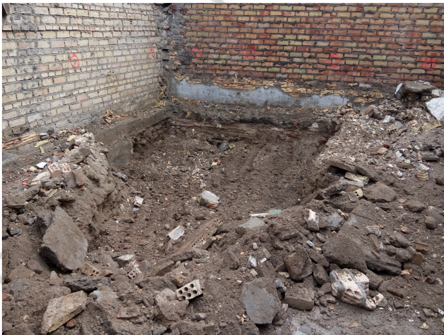
Fig. 2. Desmante de tierras. Restos de material constructivo contemporáneo.