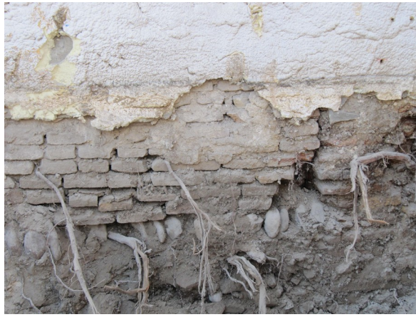
Fig. 1. Continuación de pavimento bajo medianera, lo que indica de que antes se trataba del mismo inmueble.