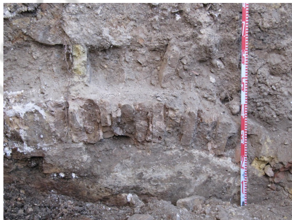
Fig. 4. Restos de bóveda arrasada, conservado en medianera sur y que se correspondería uso de la parcela en el S. XVIII.