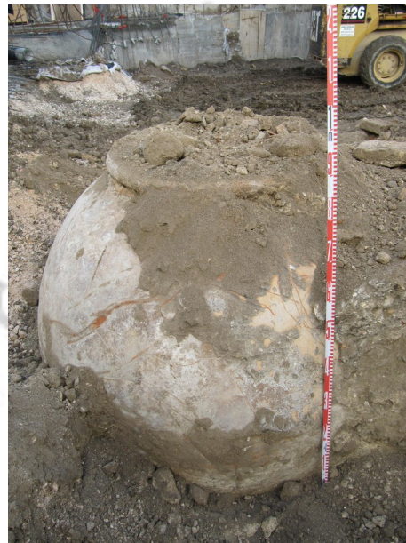
Fig.2 y 3. Tinajas de almacenamiento.