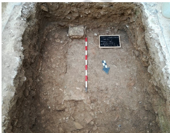
Lám.2. Sondeo n°1.

En este caso, se han utilizado algunos parámetros de análisis para identificar estratigrafías y niveles de deposición, no realizándose todas las analíticas anteriormente propuestas como la recogida selectiva de fauna, análisis de ph o recogida de muestras para su estudio en laboratorio.