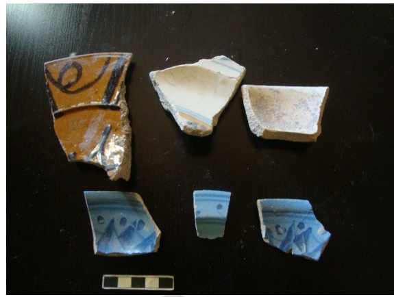
Lám.15. Cerámica melada y azul sobre azul.