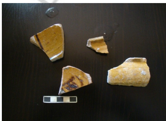
Lám.12. Materiales sondeos

La gran crisis demográfica del siglo XVII, se ceba sobre estos barrios despoblándose una vez más al ser más sensibles a la peste (agravada por las inundaciones) y las hambrunas, en especial la de 1649. No es hasta el siglo XIX cuando la zona se vuelve a repoblar con mayor fuerza fruto de la actividad industrial que se establece a esta zona de la ciudad, lo que fomenta el desarrollo constructivo del barrio.