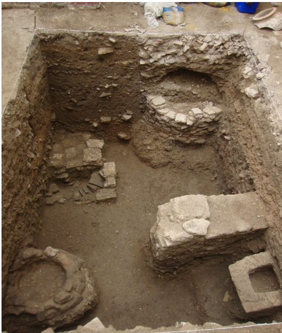
Lám.6. Sondeo nº5.