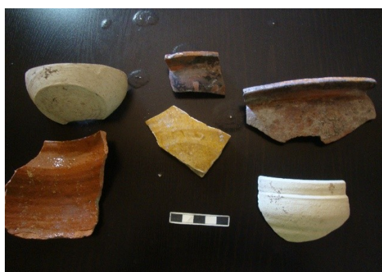
Lám.13. Cerámica doméstica.