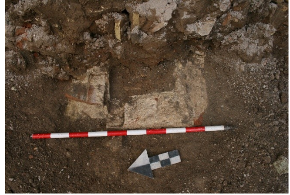
Lám.10. Otra maquinaria en las labores de rebaje Lám.11. Pileta época Mudéjar.

Se localiza parte de una estructura hidráulica (S. XV-XVI).