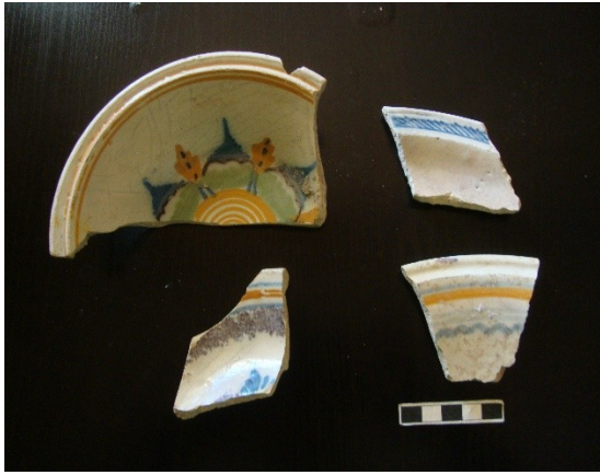
Lám.14. Cerámica doméstica.