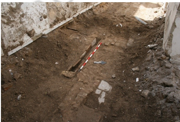
Lám.8. Detalle de canal localizado durante rebaje.