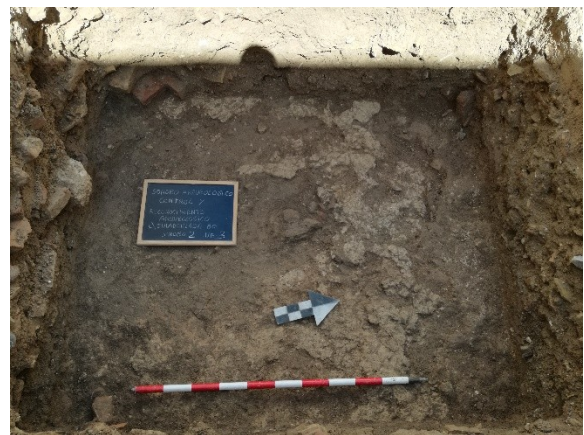
Lám.3. Sondeo n°2