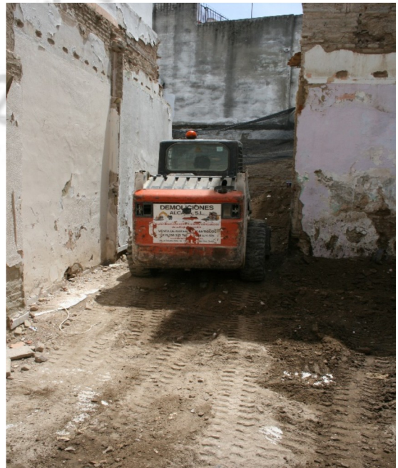
Lám.7. Maquinaria utilizada para el rebaje.