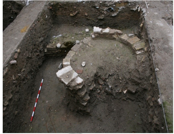
Lám.5. Sondeo nº4.