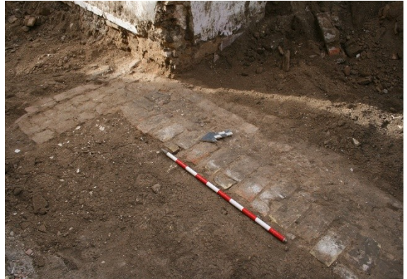
Lám. 9. Cierre muro vivienda S. XIX.