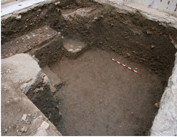
Lám.4. Sondeo nº3.