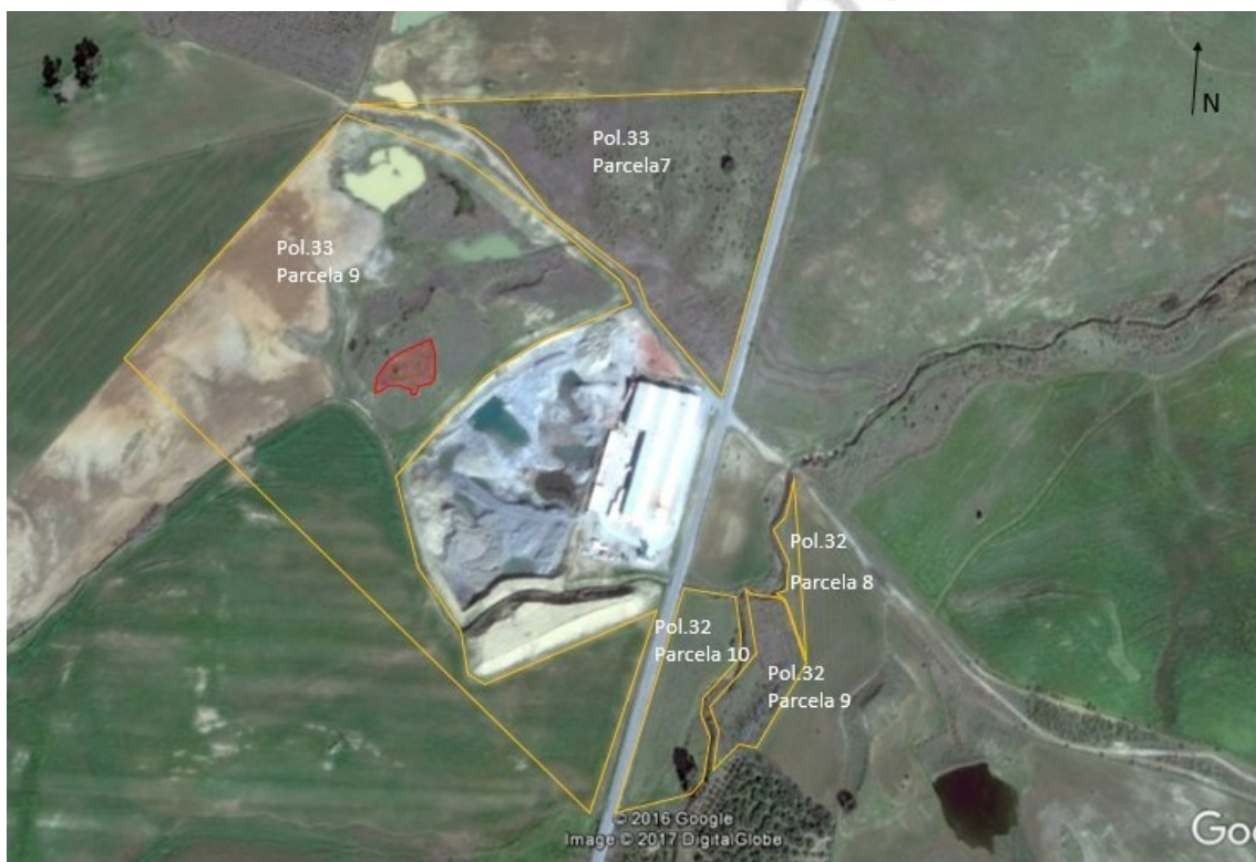
Figura 2: Delimitación de las parcelas prospectadas sobre imagen aérea

La tercera fase consistió en un levantamiento topográfico El trabajo comenzó topografiando el perímetro del área afectada, tomando los puntos donde claramente encontrábamos restos murarios y que previamente habíamos marcado mediante estacas. Una vez delimitado el perímetro, se procedió a topografiar aquellas estructuras o alineaciones murarias que pudimos observar en el interior. Por último, el equipo topográfico terminó el trabajo de campo realizando un reportaje de ortofotografías con Dron sobre las que se volcaría el levantamiento topográfico.