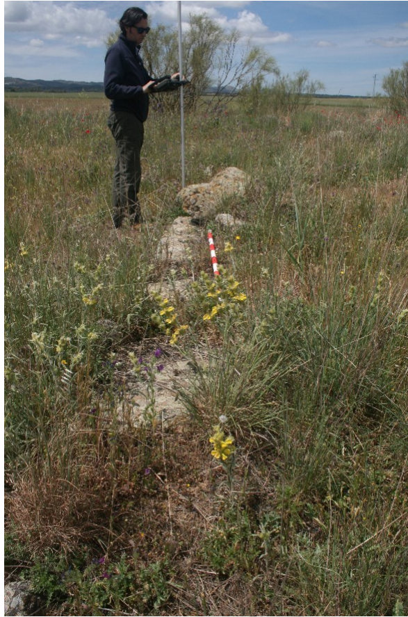
Figura 7: estructura C

Al Sur del punto 17, se documenta una estructura de planta cuadrangular. Sus muros, de los que se aprecia una potencia máxima de 0,50 mts, se encuentran muy deteriorados y cubiertos de vegetación, lo que dificulta su definición. A simple vista se observa que tiene una fábrica de mampuesto de piedra arenisca y caliza colocados a sangre. Tiene unos 8 mts de lado y los paramentos presentan 1 mt de espesor.