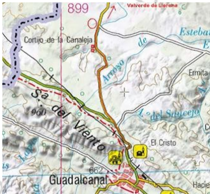
Fig.1: Situación del área de intervención sobre topográfico

La ubicación de los terrenos actuales de la Cantera se sitúan el término municipal de Guadalcanal (Sevilla), siendo el área autorizada 7,5 Ha. El área prospectada se localiza en las parcelas 7 y 9 del polígono 33, además del polígono 32, las parcelas 8, 9 y 10, del municipio de Guadalcanal, en la Carretera de Guadalcanal- Valverde de Llerena, Km.5, en el término municipal de Guadalcanal (Sevilla).