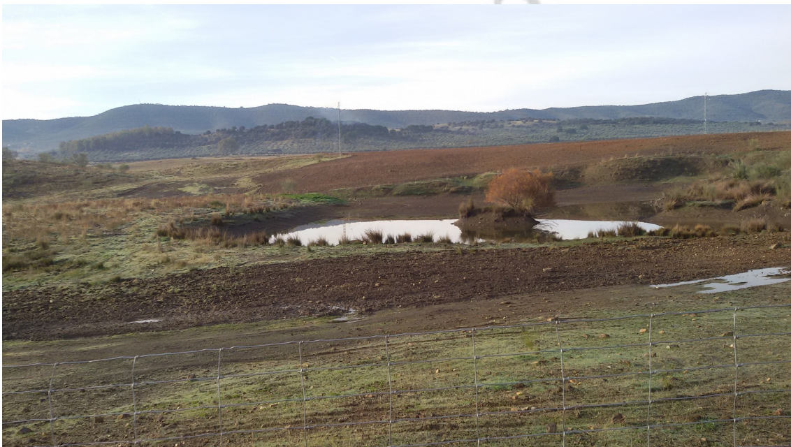
Figura 3: vista del sector degradado con ausencia de suelo original

En la parcela 9 del pol.33, encontramos un sector degradado parcialmente por antiguas explotaciones, por lo que no conserva el suelo ni el subsuelo original. Entre este sector observamos áreas donde la extracción de áridos ha generado cotas negativas donde en la actualidad existen pequeñas láminas de agua. Pero también encontramos áreas con suelo restaurado, por lo que el suelo y subsuelo es contemporáneo.