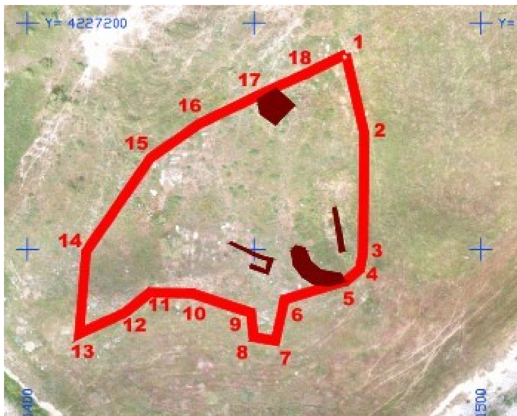
Figura 4 desarrollo de las estructuras sobre ortofoto

Si observamos el levantamiento tanto sobre ortofoto como sobre topográfico observamos que el recinto perimetral presenta una forma irregular.