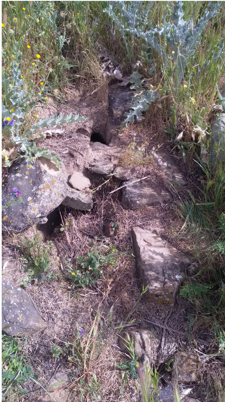
Figura 5 vista de la estructura A

En el punto 5, arranca una estructura de planta circular, conformando un arco, con un volumen considerable de en torno a 1,5 mts de ancho por 10 mts de largo realizado con mampuesto de piedra arenisca y caliza.