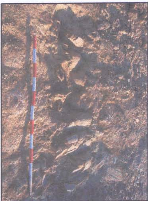
E.5.a.3. - vista desde el Norte