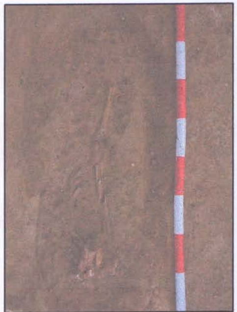
E.5.a.2. - vista desde el Norte