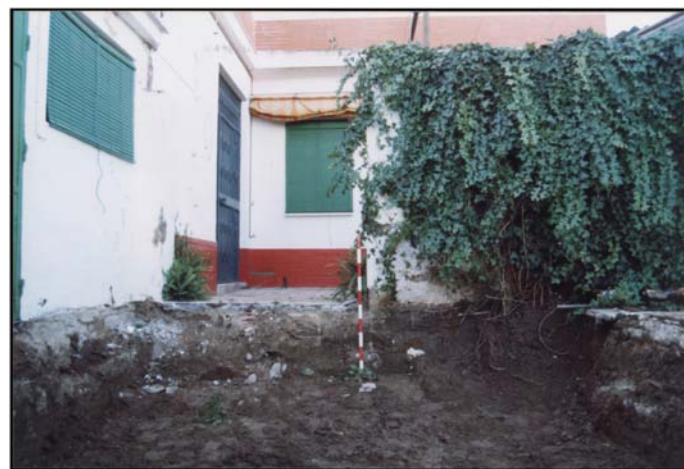
Lámina III. Zona trasera de la vivienda anterior y piscina. La foto muestra el proceso rebaje a -0,50 metros de profundidad.