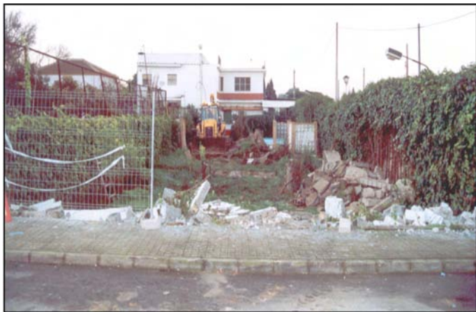
Lámina I. Fotografía que muestra el inmueble desde la calle Emilio Prados.

Por tanto la conclusión más destacada para esta breve intervención arqueológica realizada en la Avenida de Andalucía nº 17 sería la detección de una zona de vaguada que advertiría que alrededor de esta cota de 148 m.s.n.m. los estratos con contenido arqueológico rondaría la profundidad al menos de -1,37 metros aproximadamente.