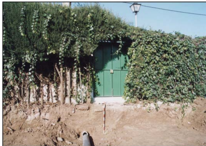
Lámina II. Puerta que da a la calle Ruisseñor donde se aprecia el metro rebajado.